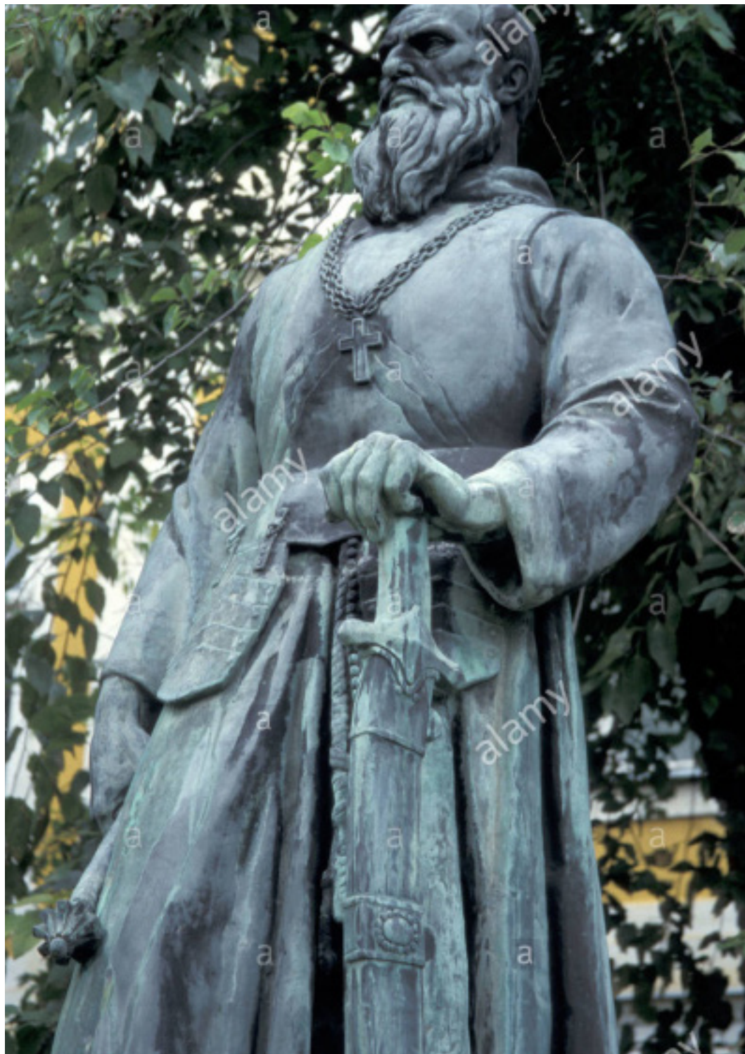
Tomori érsek szobra Kalocsán