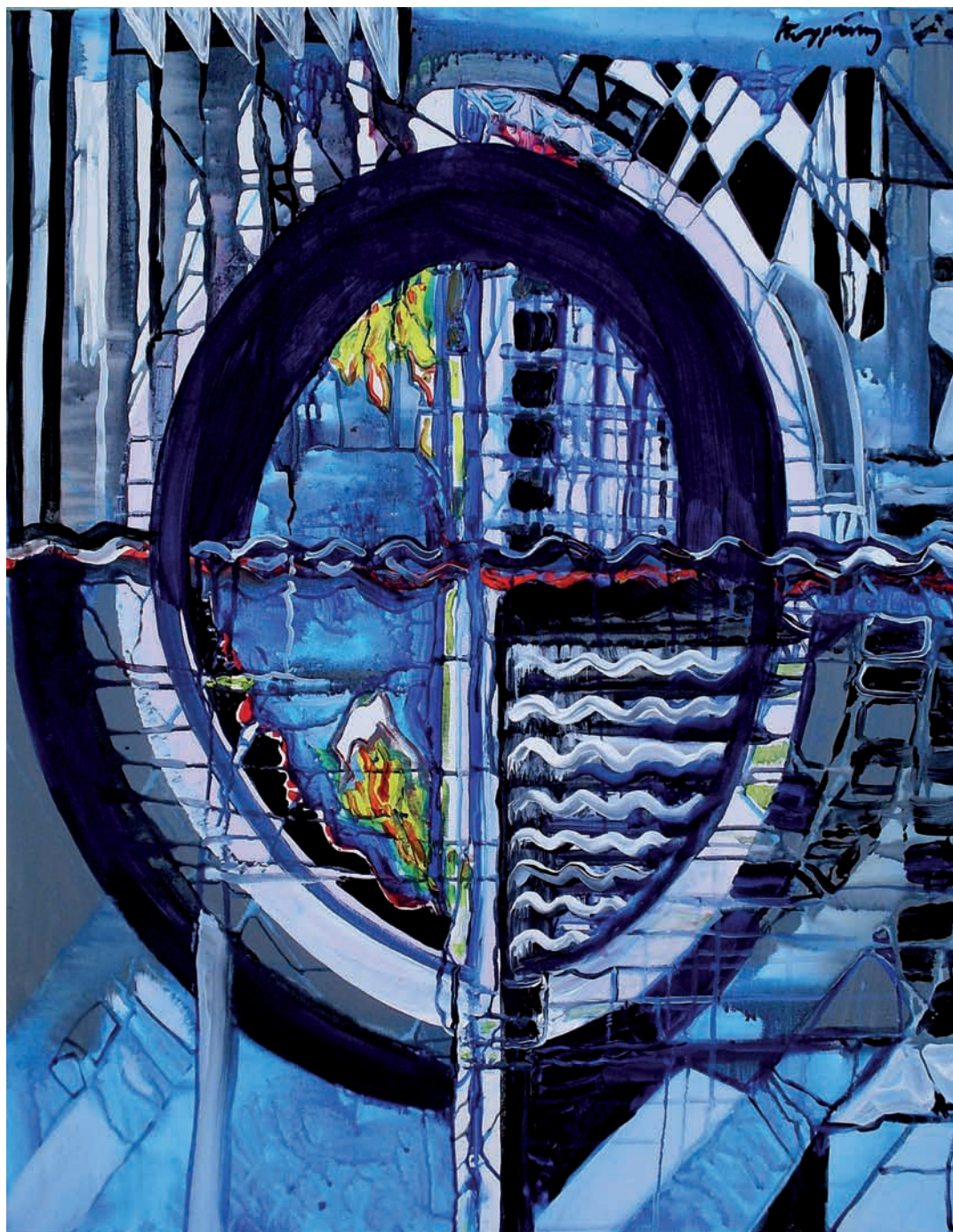
Űr-objektum (akril, vászon) 90 x 70 cm, 2008.