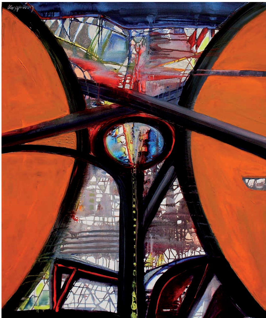
Homokóra (akril, vászon) 120 x 100 cm, 2008.