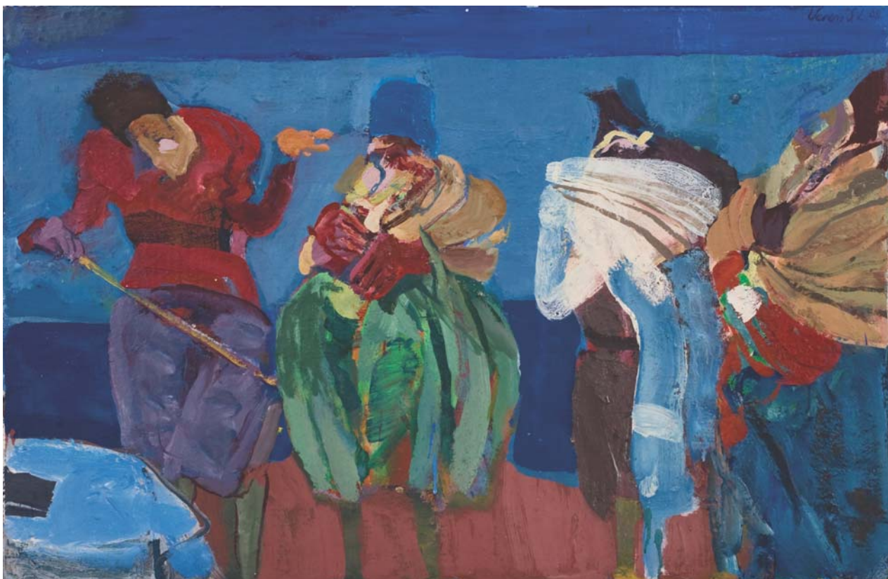
Maskarák, 2008, olaj, parafa, 57 x 88 cm, j. f.: Veress S. L. 08