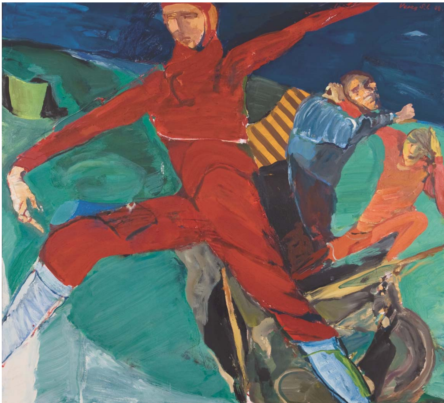
A motoros és a verekedők, 2008, olaj, vászon, 90 x 115 cm, j. f.: Veress S. L. 08