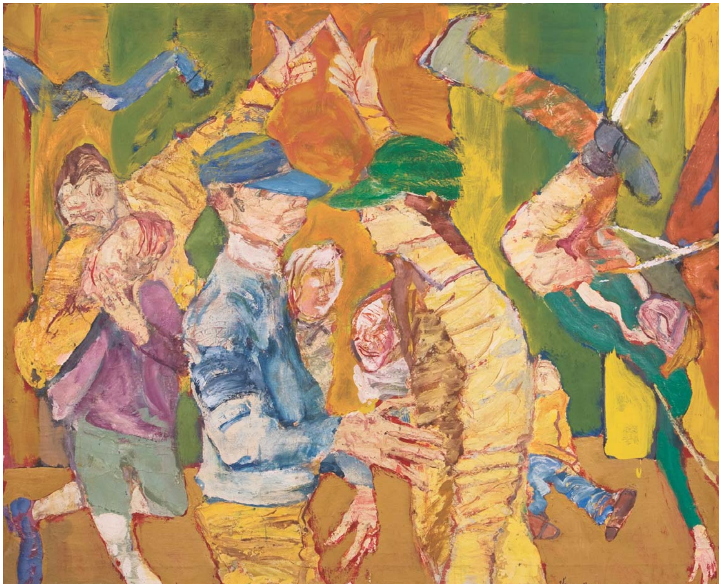
Örömteli boldog játék, 2007, olaj, vászon, 110 x 120 cm, j. l.: Veress S. L. 08