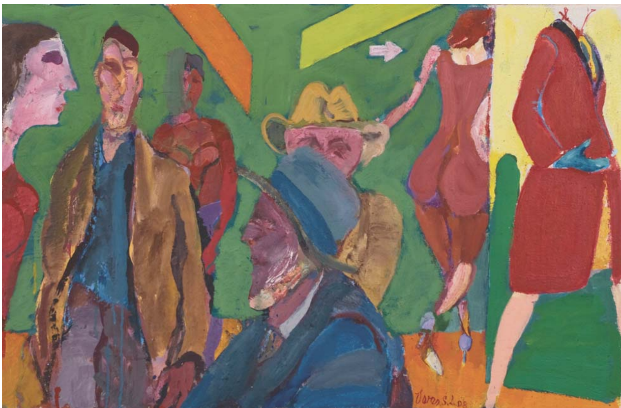
Aluljáróban, 2008, olaj, parafa, 57 x 88 cm, j. l.: Veress S. L. 08