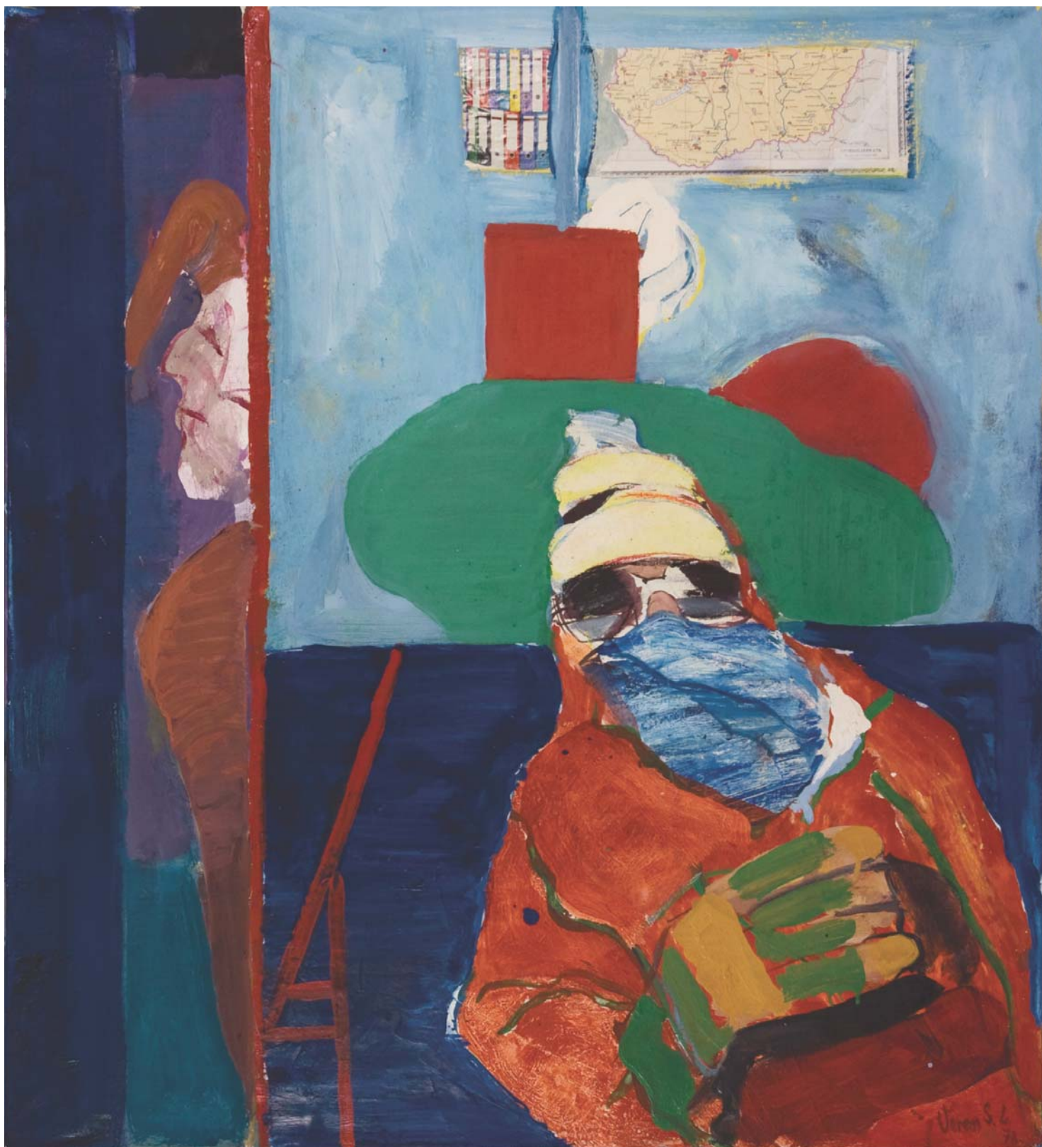
Budapesti Amundsen, 1998, olaj, vászon, 100 x 90 cmj. l.: Veress S. L. 98

A 3. oldalon: Két férfi vörös szobában (1956-os emlék), 2008, olaj, vászon, 85 x 135 cm, b. f.: Veress S. L. 08