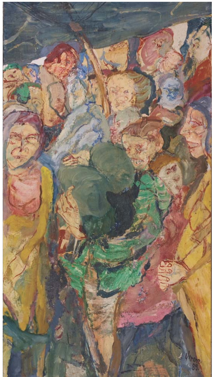
Dinnyepiac, 1989, olaj, vászon, 180 x 100 cm, j. l.: Veress 89

Veress Sándor László. (Kat., Budapest 2005)