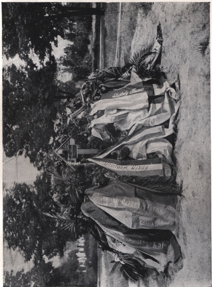
MIKSZÁTH SÍRDOMBJA A TEMETÉS UTÁN A KEREPESI-ÚTI TEMETŐBEN.