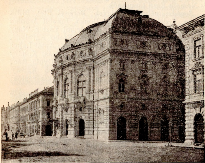
Szeged városi színház.

latív, vagy szerződési ügyekkel bibelődik, mint a legtöbb vidéki színügyi bizottság, de egyes tagoknak, a színészek játszásáról, a darabok elrendezéséről, a próbákról s általában a játékok művészi nivójának emeléséről igen sokszor rendkívül talpraesett és finom művészi érzékről tanuskodó jelentését, bírálatát, észrevételeit és megjegyzéseit találjuk. Tagjait mindenkor a városi tanács nevezi ki.