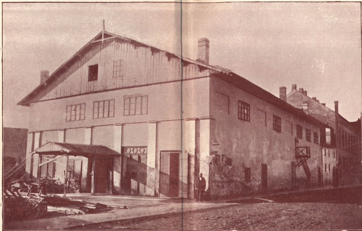
AZ ELSŐ ÖNÁLLÓ SZEGEDI SZÍNHÁZ (1856—1883).

(Az eredeti kép_Szmollény N. birtokában.)