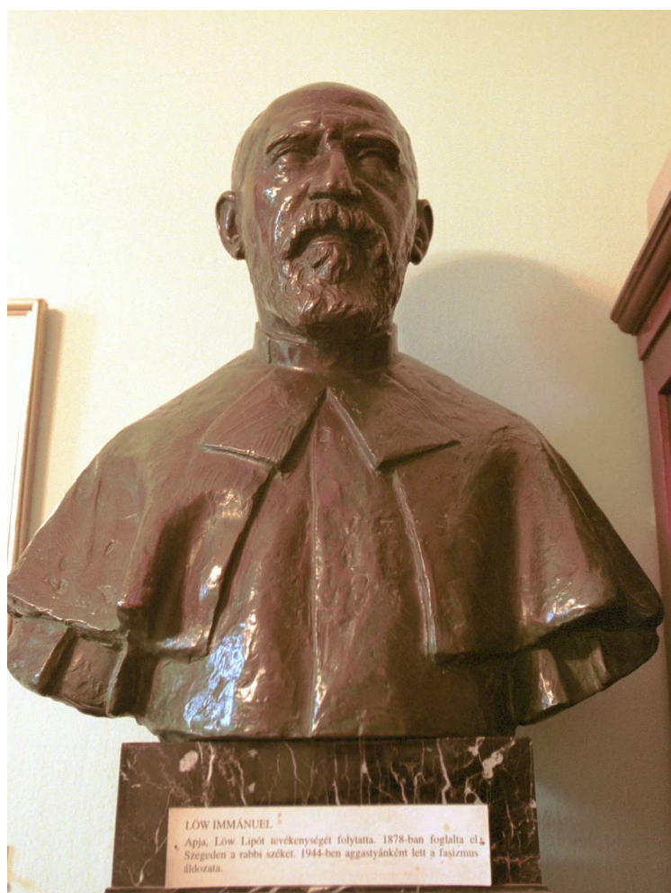
Petri Lajos: Löw Immánuel

Budapesten lekapcsolták a vonatról azt a vagon, amelyben 66 személy, közöttük Löw Immánuel utazott. 253 A főpap ekkor más a téglagyári kemence padlóján kapott kétoldali tüdőgyulladásban szenvedvén, többnyire a láztól önkívületi állapotban haldoklott. 254 Szeged tudós rabbiját a tudományokban utóda és követője, Scheiber Sándor Budapesten megtalálta. Mint írta: “Amikor az Aréna úti zsinagóga gyűjtőtáborához értem, épp mentőautóba emelték a deportáló vagonból kimentett, összetört, vak tudóst. Egy üveg meleg levest nyújtottam be neki.” 255 Löw Immánuel Budapesten, 1944. július 19-én halt meg. Felesége, született Brenning Bella túlélte a vészkorszakot, 1950. december 27-én hunyt el. 256