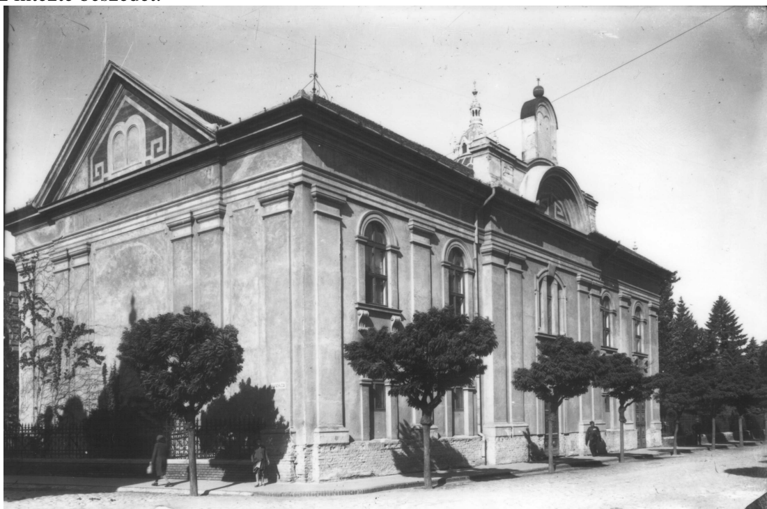
Az Ózsinagóga

Felépítették a második zsinagógát. Ezt 1843. május 19-én avatta föl Schwab (Löw) Arszlán pesti főrabbi. Schwab Arszlán nemesen egyszerűnek és az ország akkori legszebb zsinagógájának nevezte az épületet. 26 A pesti vendéggel kántor és 20 tagú énekkar is érkezett, mivel Szegeden kar akkor még nem volt. Az énekkar alkalmazása épp úgy neológ újításnak számított, mint az, hogy a szegedi hitközségi jegyző, Bauer Márkfi Herman magyar ajkú, kedves érdemtelen hitfeleihez intézte beszédét. 27