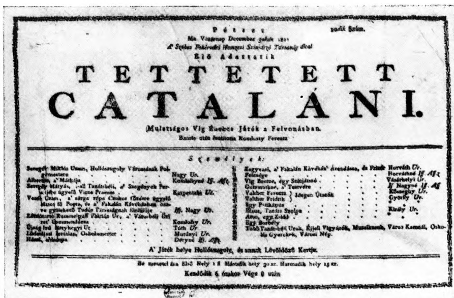
2. kép. 1821. dec. 30.