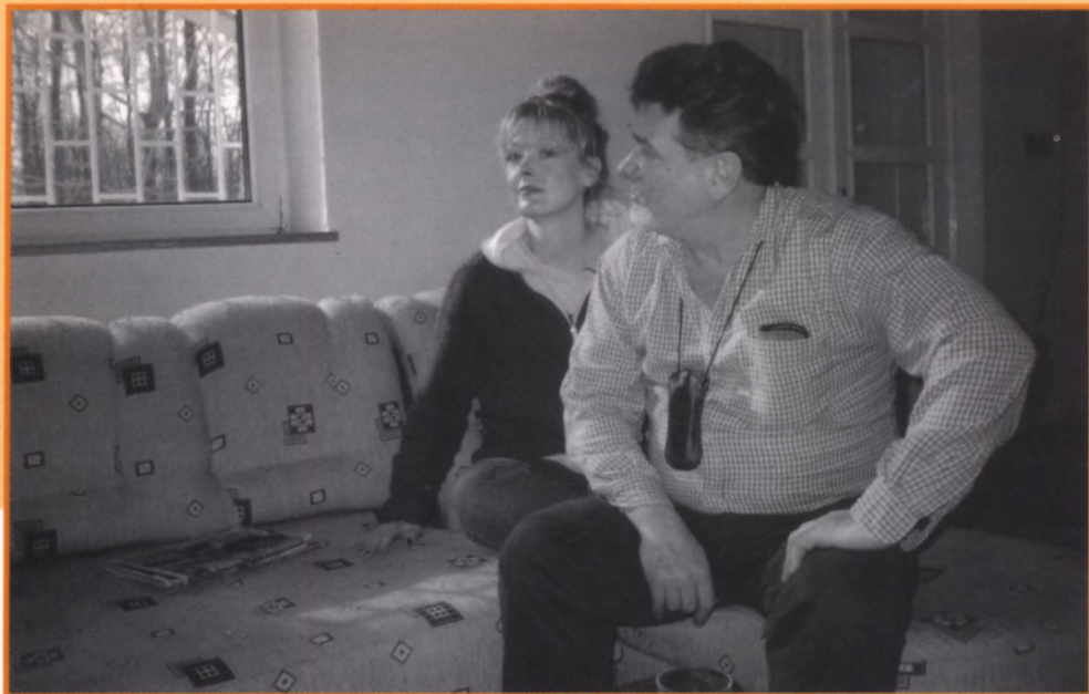
A SZERZŐ ÉS LEÁNYA FOTÓJÁT KONCZERNÉ ERIKA KÉSZÍTETTE

Ezeket a verseket negyven év írásaiból választottam. A tájjal maradtam című előző kötetem verseinek „holdudvara” ez az összeállítás.