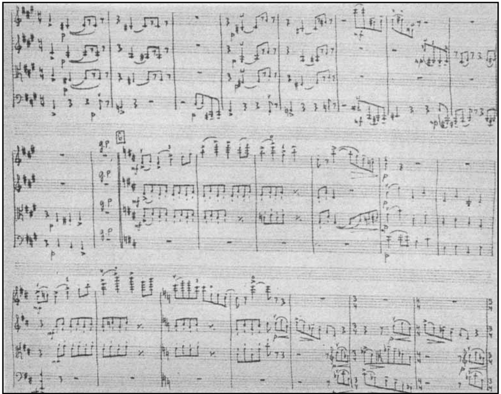
PROKOFJEV KÉZÍRÁSA – RÉSZLET AZ I. VONÓSNÉGYESBŐL