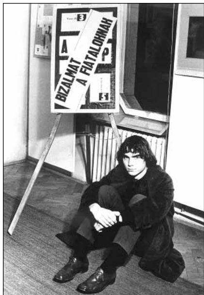
Bizalmat a fiataloknak Magatartásmunka, Újvidék, 1971

hamis látszatokra, beidegzettségekre épülő konvenciók „átvilágítását”, széttörését kell a művésznek elvégeznie, s csak azután kezdődhet az „építkezés”, immár új alapokon. Kassák nyomán indulva tartja tehát az avantgárdot „magatartás-művészet”-nek: a dolgok gyökeréig hatolva le kell bontani a hazug felszíni struktúrákat s felmutatni az azok mögött rejtőző lényegi összefüggéseket; az igazságot kell szabadon és megalkuvás nélkül kifejezni a korról – ha szükséges, az akció-provokáció eszközeivel. Az „élet egyenlő művészet” – „művészet egyenlő élet” konceptualista felfogást vallva hangsúlyozza: „Nem létezik egyetlen olyannyira zárt költészeti rendszer vagy modell sem, amely ne mutatna túl önmagán. Mint ahogy a való élet dolgai közt, a hétköznapi cselekedeteiben sincs olyan prózái mozzanat, amely ne lenne rokonítható bizonyos költészeti tartalmakkal, kezdve az emberi gesztusoktól a magatartásformában rejlő általánosabb