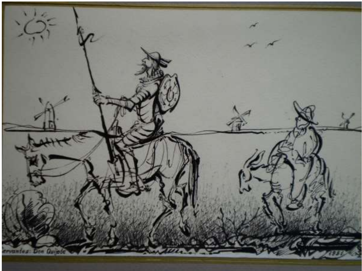
Cervantes Don Quijote