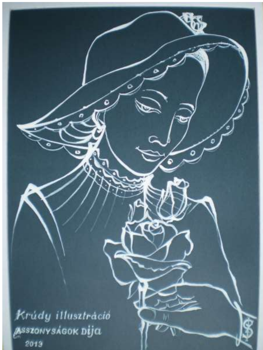
Krúdy Asszonyok Díja