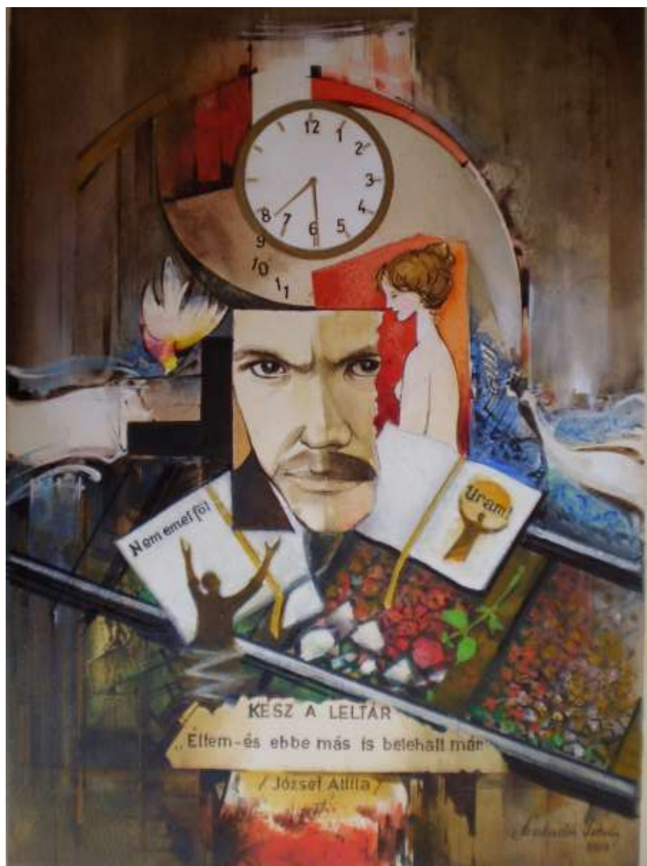
József Attila Kész a Leltár