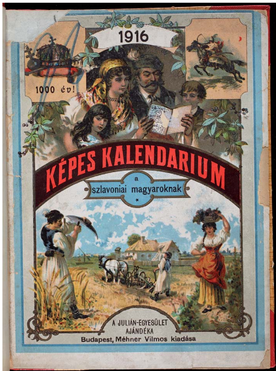
Julián Kalendárium 1916