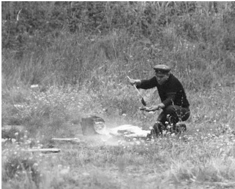
A váltóőr kávéét főz (vagy éppen szalonnát süt?...)

Mi mindenre jó egy kávészünet? Hát kortyok tikk-takkja közben, mialatt a zacc a homokóra egyik bubijából átszivárog a másikba, minden megtörténhet: ami máskor sosem. Ez az idő, az időből kiszakított, a tökéletes autocentrizmus. (Ady András)