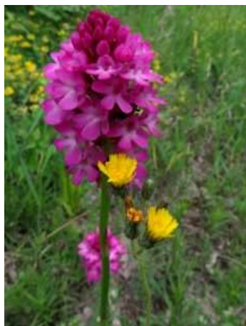
Vitézvirág ( Anacamptis pyramidalis ), védett, 10.000 Ft/egyed, fotó: Etter Dénes