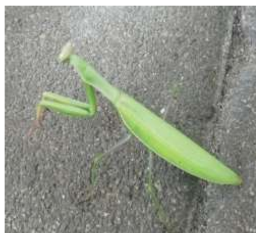
Imádkozó sáska ( Mantis religiosa ) védett, 5.000 Ft/egyed