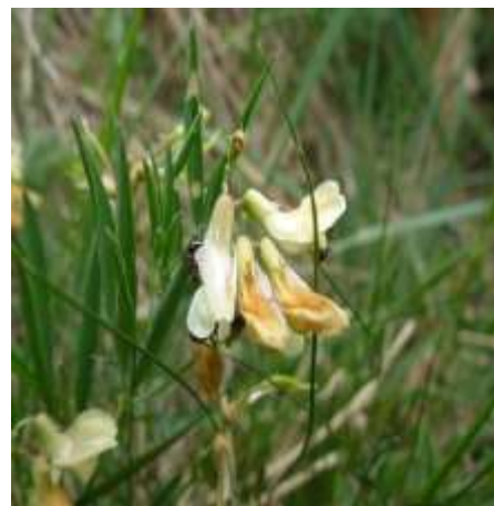
Sápadt lednek ( Lathyrus pallescens ), fok. védett, 250.000 Ft/egyed