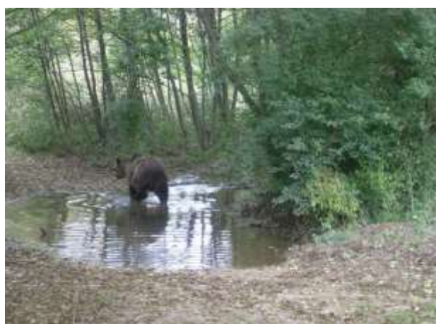
Barna medve ( Ursus arctos ) fokozottan védett, 250.000 Ft/egyed