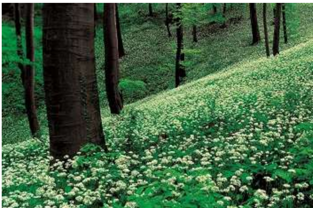
Medvehagymás bükkös, fotó: dr. Kalotás Zsolt

2011. évi LXXVII. törvény a világörökségről (Világörökség Egyezmény – természeti világörökségi helyszínek és kultúrtájak)