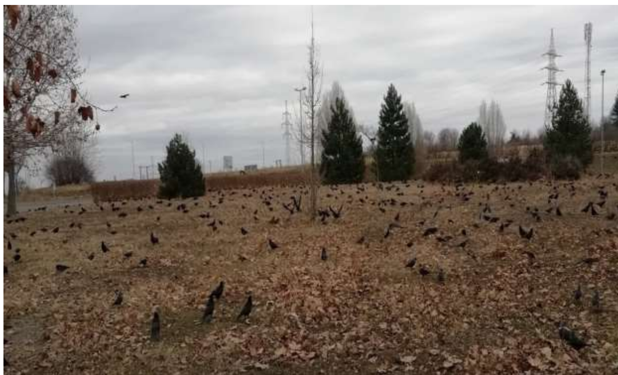
Vetési varjú sokadalom, Pécs, 2018. dec. 30.

Vetési varjú ( Corvus frugilegus ), védett, 50.000 Ft/egyed