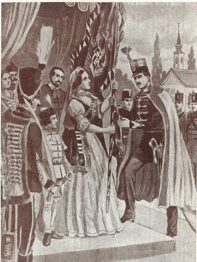
Teleki Blanka grófnő átadja a csatába induló Vasvári Pálnak a lobogót.