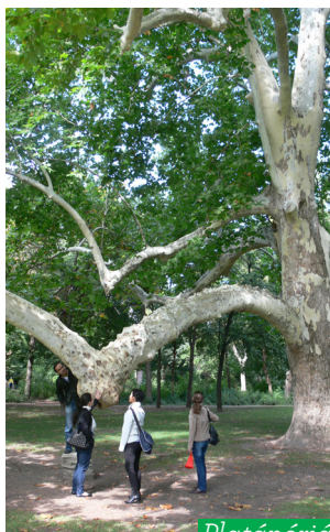
Platánóriás ( Platanus acerifolia )

Visszafordulva az északi szigetcsúcstól elhaladunk a modern Danubius Thermal Hotel (az egykori Margit fürdő helyén) és a patinás Ybl Miklós által tervezett neoreneszánsz Danubius Grand Hotel előtt és máris a rekonstruált premontrei kápolna állít meg középkori szépségével a Művész sétányon haladva.