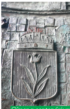
Címer a centenáriumi emlékművön

névadóhoz, Árpád-házi Szent Margithoz. A 10 éves Margit 1252-ben költözött át 17 társával a számára alapított nyulak-szigeti kolostorba, és haláláig (1271) szolgált, gyógyított a falak között. A XV. században a boldogok közé számították és 1943-ban szentté avatták. A domonkos rendi apácák 1540-ben elhagyták a szigetet és magukkal vitték Boldog Margit földi maradványait. A Sziget a XVI. századra elnéptelenedett, a szerzetesek Buda török kézre jutásakor elmenekültek.