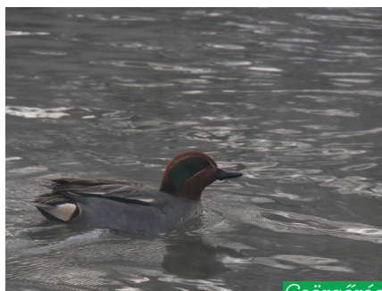
Csörgőréce ( Anas crecca )

A Sziget további fontosabb középületeit felsorolásszerűen említjük: MAC Sporttelep, Palatinus Strandfürdő, Hajós Alfréd Nemzeti Sportuszoda, Víztorony, Szabadtéri Nagyszínpad.