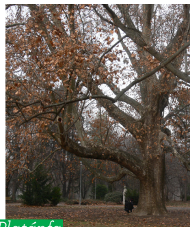
Platánfa ( Platanaceae )

Utunk során az első, történelmi időkre emlékeztető rom-együttes az egykori Minorita Ferences templom megmaradt falainak maradványa. József nádor felesége számára építtetett klasszicista nyaralója a ferencesek egykori templomának északi falához támaszkodott és pompázott egykoron,