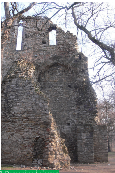
A Domonkos-kolostor romjai

Az első magyar nyelvű említés szerint Imre király (1196-1204) itt tartotta udvarát. Ez időben már létezett a premontrei kolostor, közelében Szent Pál falva nevű falucskával. Az esztergomi érseknek vára volt a szigeten az Óbuda felőli oldalon, az északi szigetcsúcson, míg a pesti parton épült IV. Béla király által ide telepített Szent János Vitézek (johanniták) nagy kiterjedésű erődítményszerű négy sarkotornyos vára a déli szigetcsúcs közelében (a Casino helyén). A Ferences minorita rend 1270-ben jelent meg a sziget nyugati oldalán, templomukban és kolostorukban a török időkig tevékenykedtek itt. A Domonkos-kolostor alapítása szorosan kapcsolódik a mai