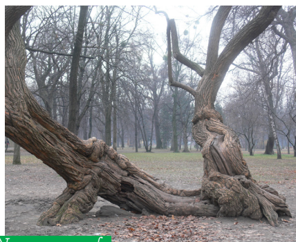
Narancseperfa ( Maclura pomifera )

A Szabadtéri színpad (1938) délnyugati sarkánál öreg tölgyek magasodnak. Alattuk kopjafa hirdeti, hogy Arany János kedves fái voltak (a költő mellszobra is itt van, egyike a sziget több tucatnyi művészetet megőrkítő emlékének).