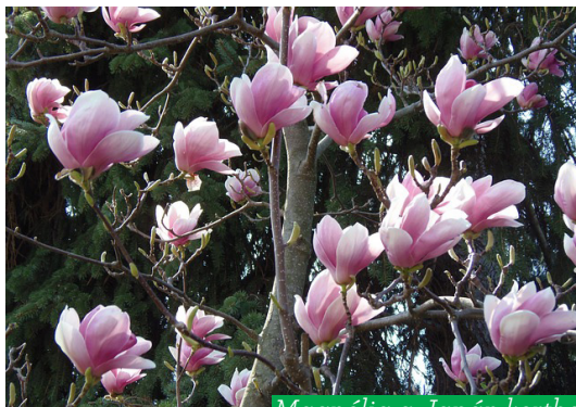
Magnólia a Japán kertben (Magnolia grandiflora)

A Margitsziget ma a XIII. kerülethez tartozik, eredeti terjedelme 58 hektár volt, mai kiterjedése szűken 1 km 2 . Földtörténeti-földrajzi szempontból Budapest legfiatalabb felszíni képződményei közé tartozik. A Dunakanyart elhagyva, alföldi szakaszra kilépő Duna a földtörténeti jelenkor elején számos zátonyt épített. A Margit-sziget alapját adó hordalékkúpja természetes állapotban nyugat felé alacsonyabb, kelet felé magasabb volt. Mai formáját a XIX. század közepén, a Duna szabályozásakor nyerte.