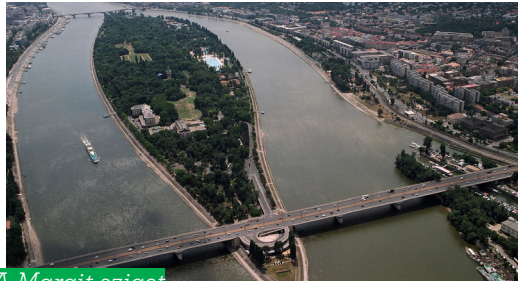
A Margit-sziget látképe

A Margit-sziget a Duna egyik szigete Budapest területén. Közigazgatásilag Budapest XIII. kerületéhez tartozik, és Margitsziget néven Budapest egyik városrészét alkotja.