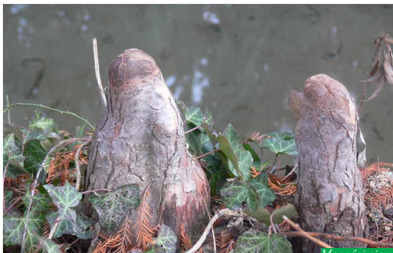
Mocsári ciprus ( Taxodium distichum )