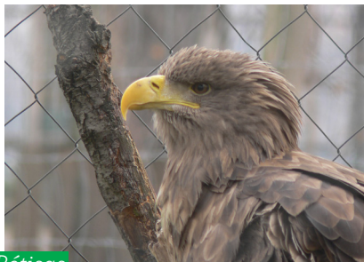
Rétisas ( Haliaeetus albicilla )

A Vadaskert egy kis állatkert, ahol nemcsak a gyerekek számára található érdekesség. A récék, tyúkok, pávák, gólyák és egerészölyvek és réti sas mellett, láthatunk itt kecskét, dámszarvasokat, őzeket, pónilovakat is. Néha még az egykori névadó nyulakat is.