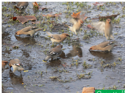
Csonttollú ( Bombycilla garrulus )

II. világháború alatt elkészült az Árpád-híd, ezt 1950-ben kötötték össze a szigettel, amin számos értékes növény- és állatfaj talál menedéket. A pihenő, sétáló emberek gyakran láthatnak itt feketerigót, harkályféleket (pl. közép- és nagy fakopáncs), parlagi galambot, széncinegét és csusz-