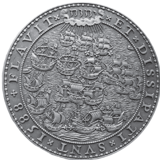
2. kép: Emlékérem a spanyol armada pusztulására, latin–héber felirattal: „Flavit יהוה [Jehovah] et dissipati sunt 1588”.

Berzsenyi már 1814-ben szentelt egy epigrammát, mely a francia császár bukását abból vezeti le, hogy „tündér kényének” vetette alá az őt a szabadság prófétájaként csodáló népeket, vagyis zsarnokként az önkényes hatalomgyakorlás útjára lépett. 68 A Fülöp-téma felmerülését, illetve az I. Erzsébet angol királynő által a spanyol Nagy Armada felett aratott 1588-as győzelem emlékére veretett érme feliratára (2. kép) tett utalást közvetlenül egy irodalmi előképre vezethetjük vissza. Ez pedig – Berzsenyi esetében nem meglepő módon – egy Schiller-vers, címe Die unüberwindliche Flotte ( A legyőzhetetlen flotta ). Az először 1786-ban publikált költemény az Anglia elleni spanyol tengeri vállalkozásnak úgy állít emléket, hogy a történelmi eseménysort az önmagát istenítő zsarnok és a „szabadon született” nép konfliktusává stilizálja, melyben Isten az utóbbi pártját fogta, amint a vers zárlatában olvasható: