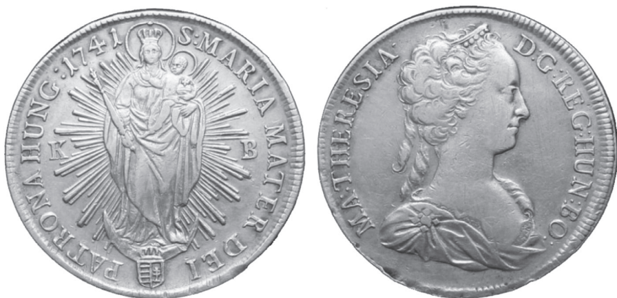
3. kép: Mária Terézia 1741-ben veretett ezüst tallérja, a hátlapon a Magyarok Nagyasszonyaként ábrázolt Szűz Máriával.

Illusztrációként a Mária Terézia által először 1741-ben veretett ezüst tallért iktatom ide, melynek két oldalán a királynő arcmása, illetve Szűz Mária mint dicsfénnyel övezett, koronás „Patrona Hungariae” látható. (3. kép) Hogy a két alak egybejátszásának hagyománya sok évtizeddel a koronázás után és nem pusztán katolikus körökben is élt, arra egyetlen példát hozok. Kölcsey Ferenc 1831-es Mária Therésia című epigrammájában így jeleníti meg a pozsonyi országgyűlésen fellépő uralkodónőt: