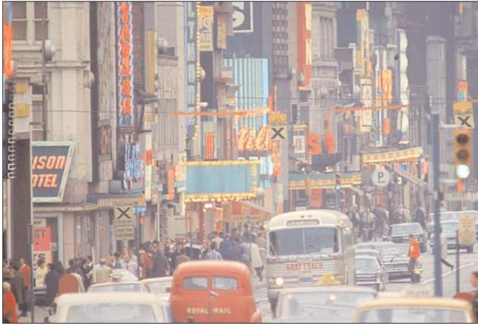
Toronto az 1960-as években