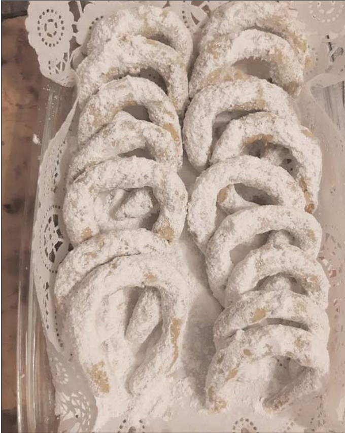
Karácsonyi tökmagos kifli