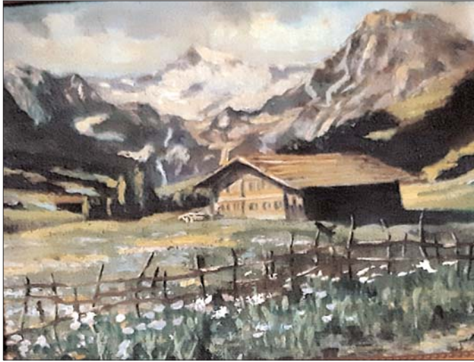
Pórdy Kálmán József: Háttérben a Matternhorn (olajfestmény, 1934)