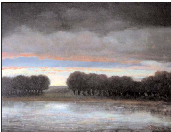
Pórty Kálmán József: Viharfelhők a Tisza felett (olajfestmény, 1937)