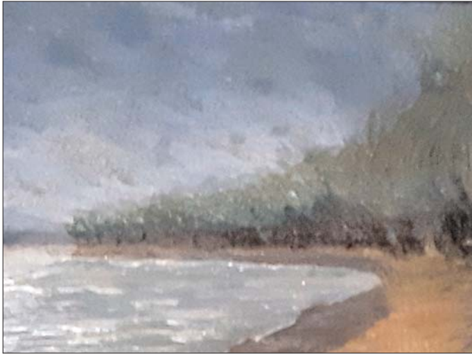
Pórdy Kálmán József: Tisza-part (olajfestmény, 1937)