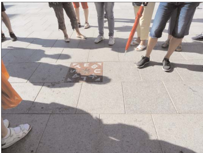
Katedrális tér a STEBUKLAS térkővel