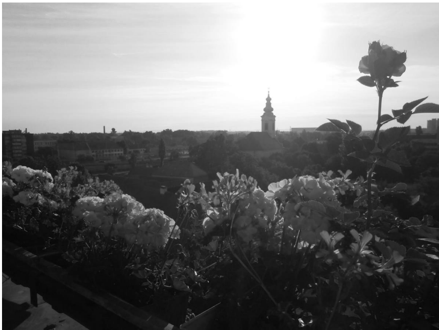
Budapest, 2017. június 10.