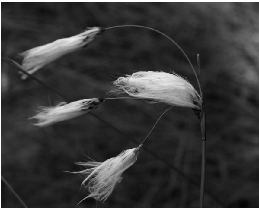
Budapest, 2016. szeptember 14.