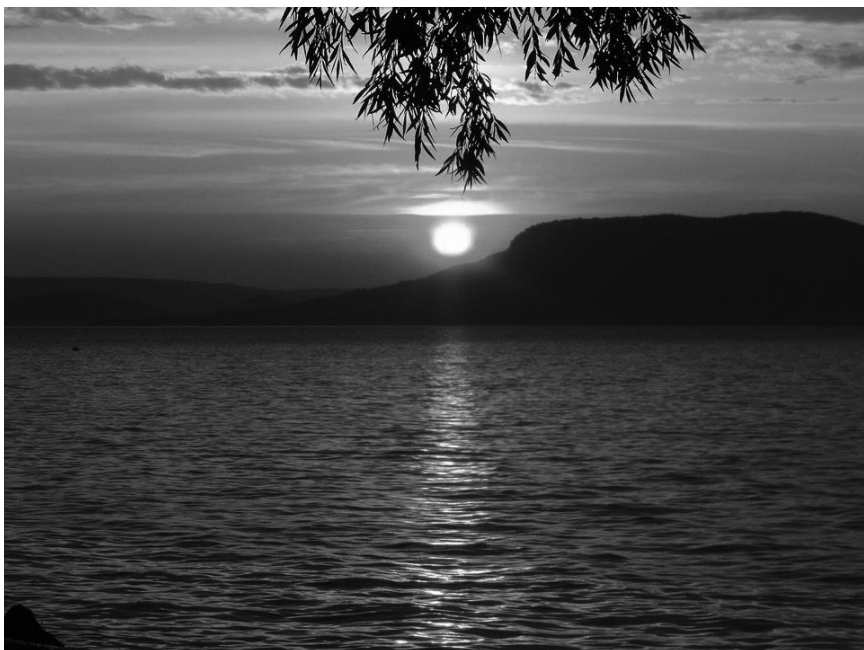
Budapest, 2017. május 6.