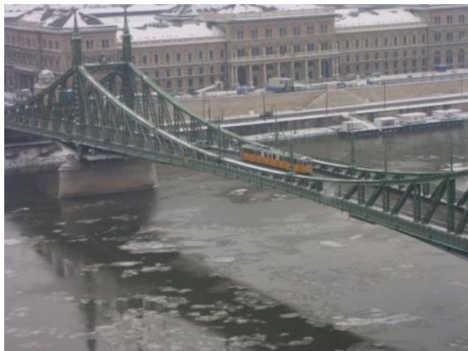
Budapest, 2017. március 18.

Borzolja szellő, rajt kecsesen sétál. Szemem távolba réved, múltat kutat. Az Úrhoz küldöm engesztelő imám.