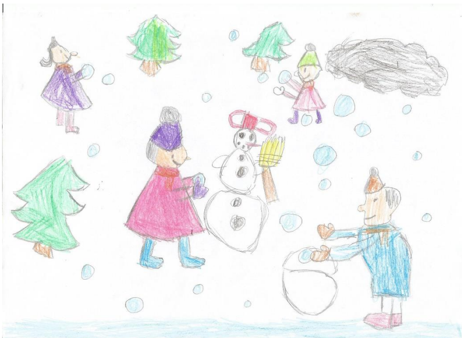
A rajzot Horváth Mihály 6 éves óvodás készítette - felkészítő pedagógus Nagy Istvánné