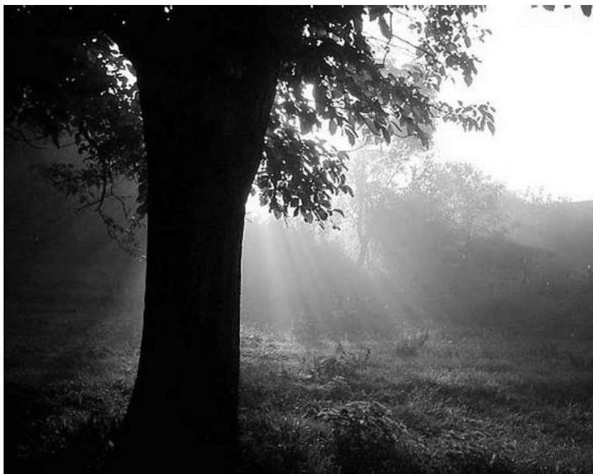
Budapest, 2016. november 6.