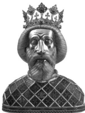
Szent László hermája

Szent László király ünnepét évszázadok óta tartják, e csodára emlékezvén, csillagjelenésnek napján.