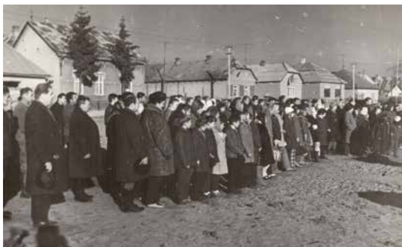
A Barátság park megnyitó ünnepsége