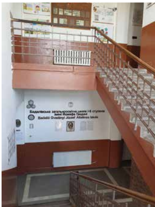
Gvadányi József Általános Iskola