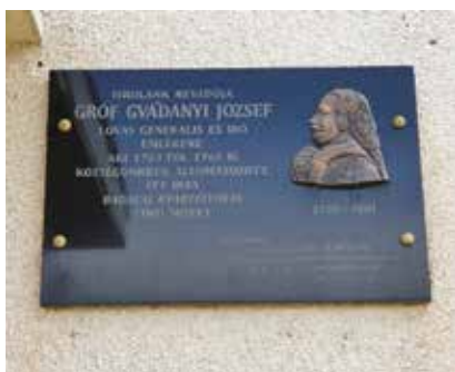
Emléktáblák az iskola falán