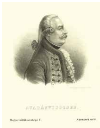
Gvadányi József író