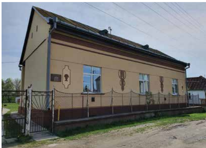
A református parókia