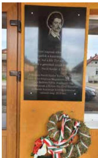
Petőfi Sándor emléktáblája a kultúrház falán