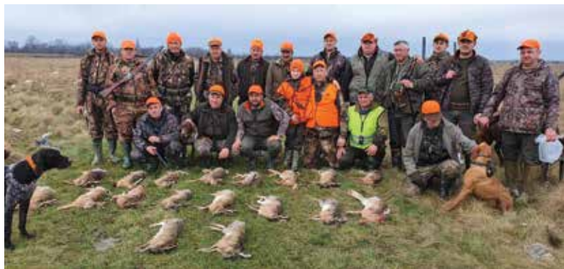
Helyi vadásztársaság (2020)