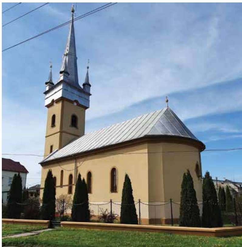
A református templom