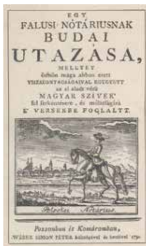
Gvadányi József „Egy falusi nótáriusnak budai utazása...” (1790)