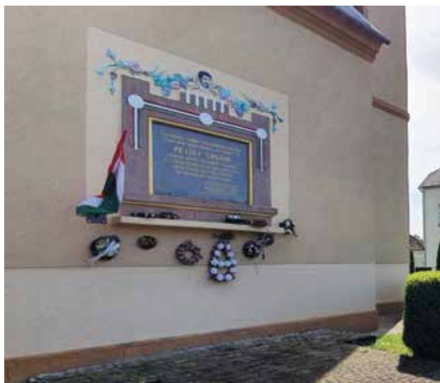
Petőfi Sándor emléktáblája a református templom falán