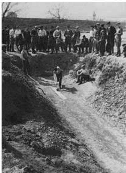
Badalói tekepálya az 1930-as években