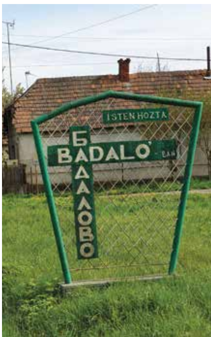
Településnévtáblák: új és régi