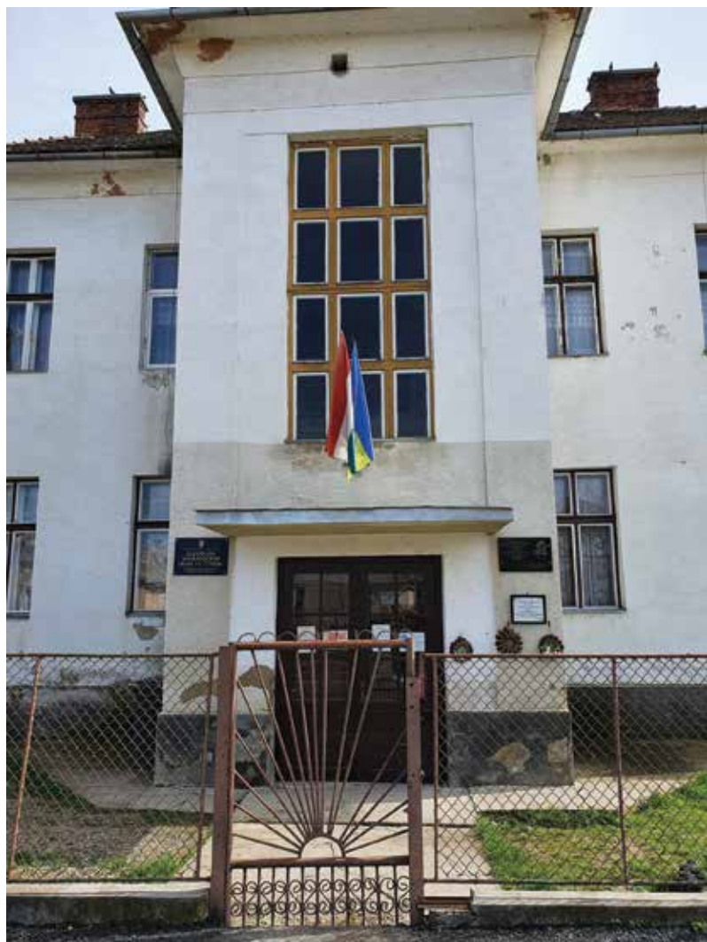
Gvadányi József Általános Iskola