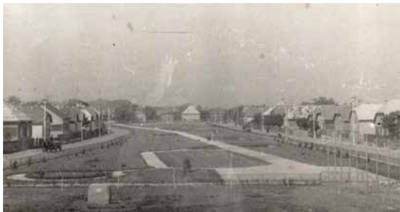
A Barátság park (a Szovjetunió megalakulásának 50. évfordulója tiszteletére, 1972)