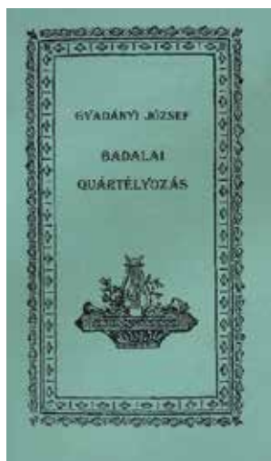
Gvadányi József „Badalai quártélyozás” című könyvének hasonmás kiadása