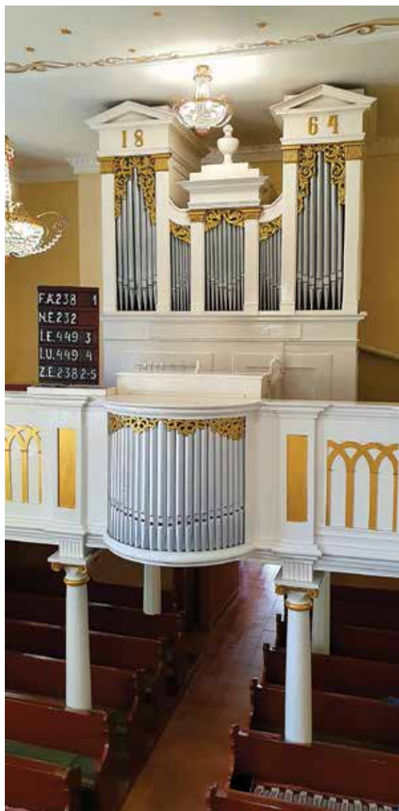
Orgona a templomban