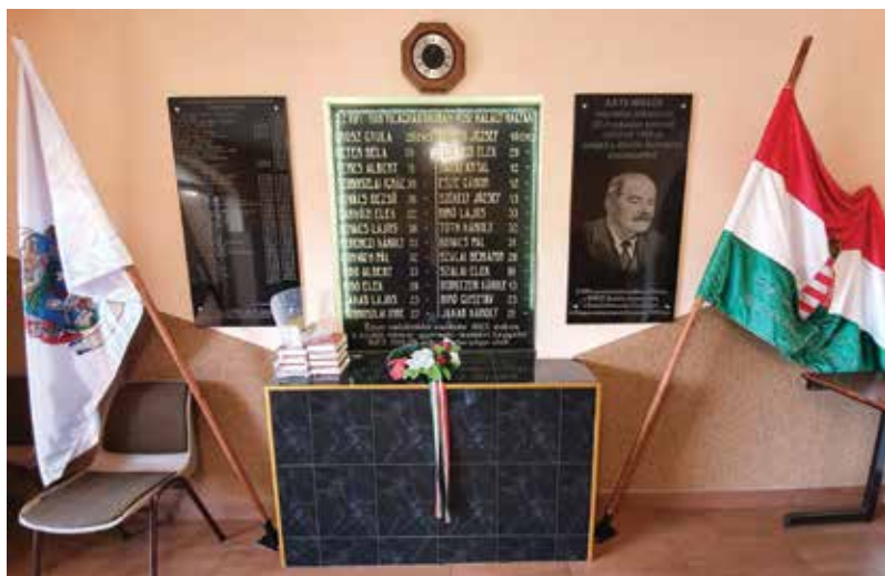
Emléktáblák a templomban