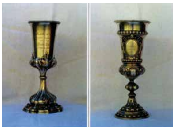
A református templom egyik kelyhe