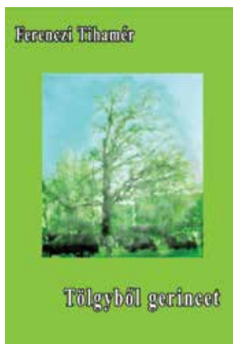
Ferenczi Tihamér „Tölgyből gerincet” című kötetének címlapja