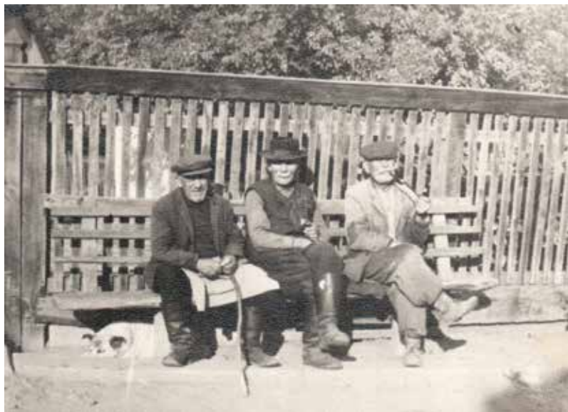
Badalói falusi porta előtt (1960-as évek)