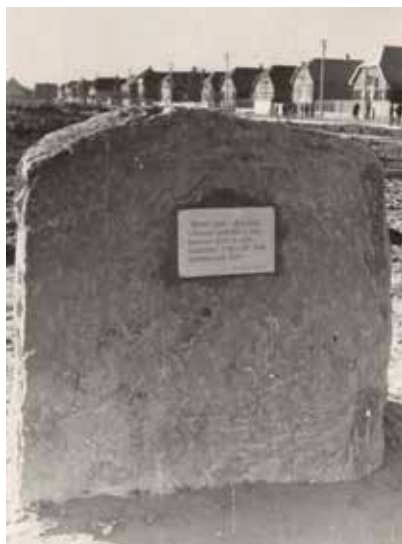
A Barátság park emlékköve (1972)