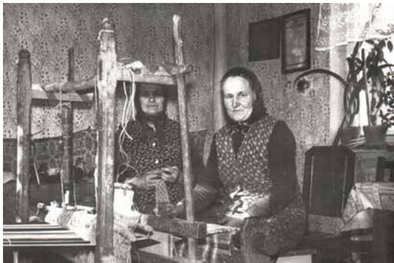
Népi hagyományok Badalóban – pokrócszövés