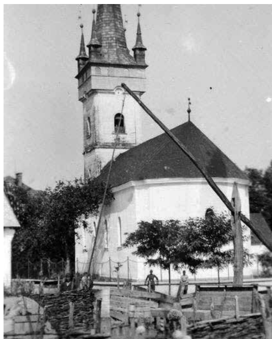
Badalói református templom (Fortapan, 1930)