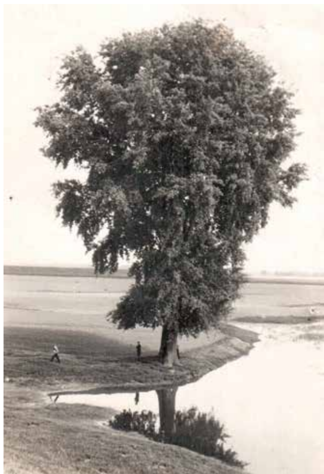
A Nagynyárfa a töltés mellett