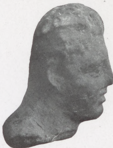
MERCURIUS FEJE OLDALNÉZETBEN

RÓMAI TERRACOTTÁK AZ AQUINCUMI MUZEUMBAN.