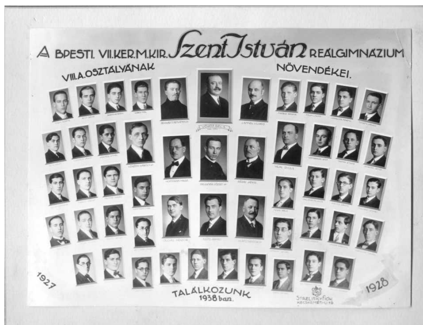
Gianone Egon érettségi tablója