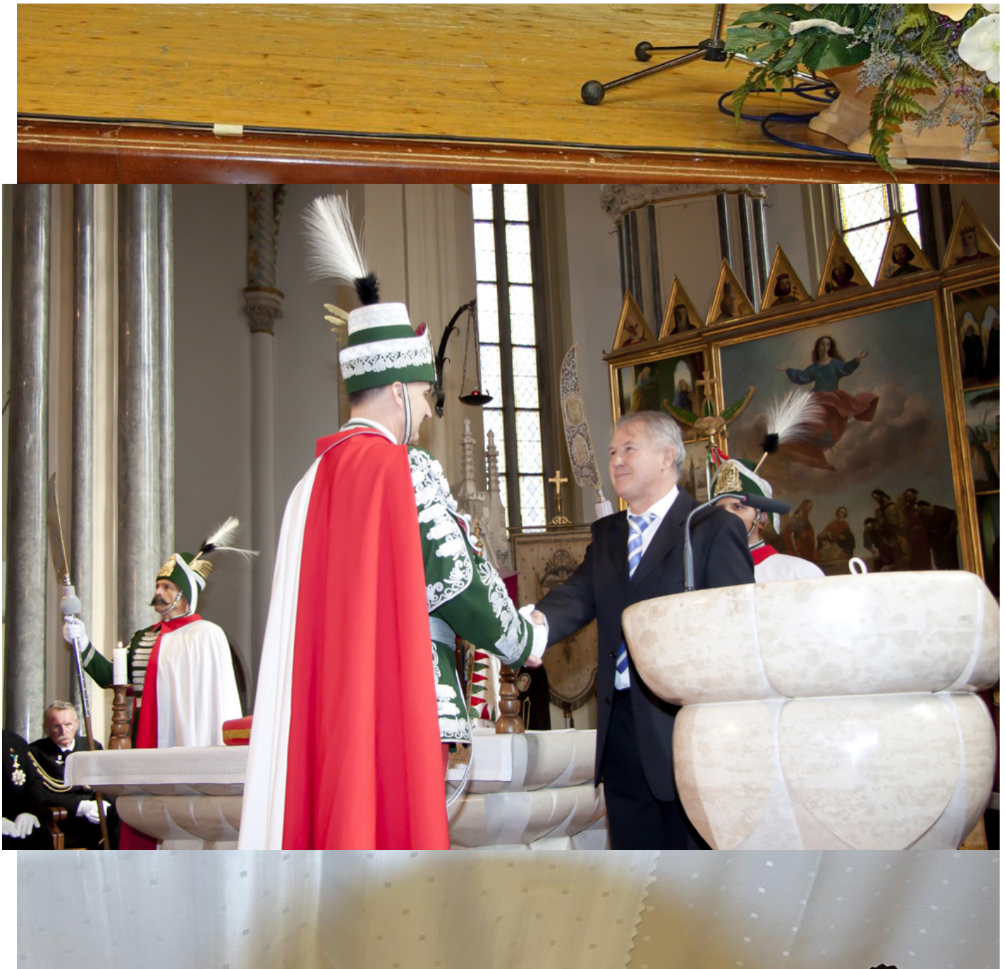
A fotón Ex Libris Díj a Magyar Koronaőrök Egyesületének a Belvárosi templomban, 2009