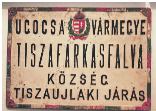
A község falutáblája a múzeummá átalakított Fogarassy-kastélyban