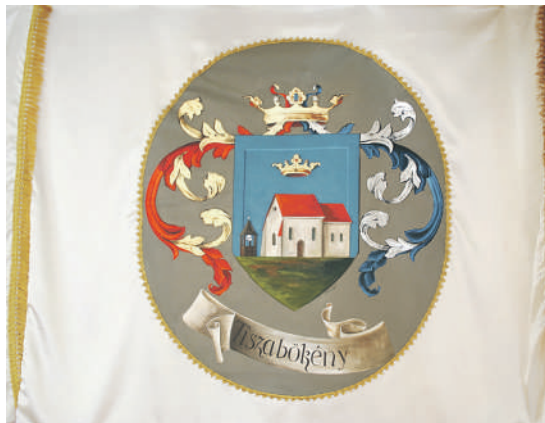
Tiszabökény zászlaja Molnár Zsolt (Zsámbok) alkotása

Tiszabökény zászlaja. Világos krém színű, sárga bojtos sáv körbe szegélyezi. A mezőben látható Tiszabökény címere.