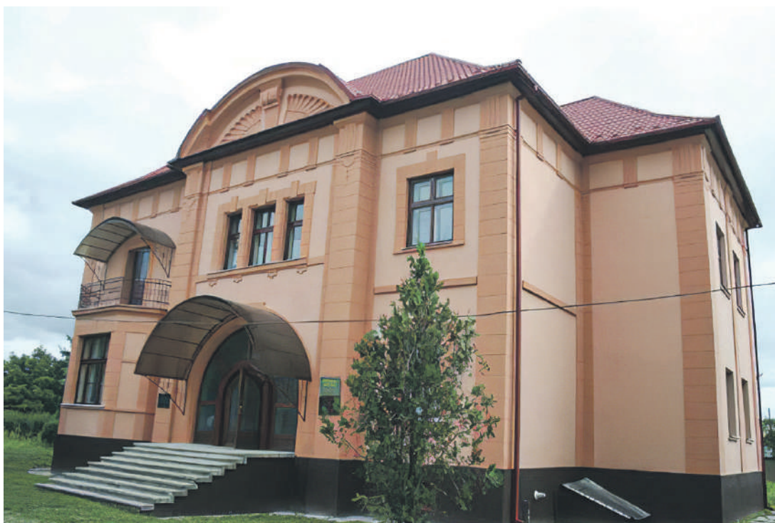
György-kastély. Péterfalvi Képtár

Fontosabb emlékhelyei: György-kastély . Tiszapéterfalva központjában található az 1870-es évek végén épült György-kastély. Nevét egykori tulajdonosáról, György Endre (1848-1927) földművelésügyi miniszterről kapta, aki nyárilaknak használta az épületet. A kastélyban 1986. augusztus 10-én Bíró Andor , a Határőr Kolhoz elnökének kezdeményezésére megnyílt a Péterfalvi Képtár, amely azóta is az épületben működik. A képtár kiállítási anyagát a kárpátaljai festőművészek közel 200 alkotása teszi ki. 2003-ban a kastély falára emléktáblát helyeztek György Endre tiszteletére.