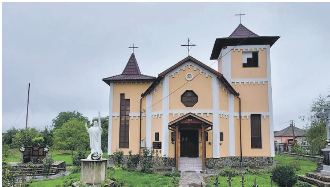
Az Árpád-házi Szent Erzsébet tiszabökényi római katolikus templom

ségekből. Legfőbb érdemük azonban az – amit Faragó László beregszászi konzul fogalmazott meg – hogy az árvizek és a többi megpróbáltatás dacára tovább építették a templomot, mert hittek Istenben, s ezért hittek abban is, hogy van jövőjük.