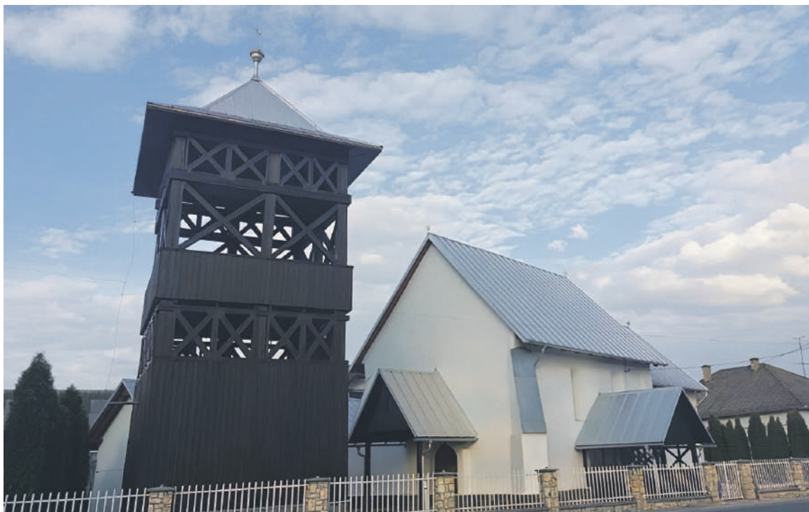
A tiszabökényi református templom

Bökény református egyháza 1554 és 1573 között keletkezett. Abban az időben a bökényi római katolikusok áttértek a református hitre, tovább használva ősi, XIII. századi templomukat. A középkori jellegét, eredeti románkori formáját megőrző, torony nélküli templomot az árvizek és pusztítások miatt többször átépítették, felújították. Mindössze a tetőzetét változtatták kisebb hajlásszögűre és a déli kapu elé fedett fatornácot építettek.