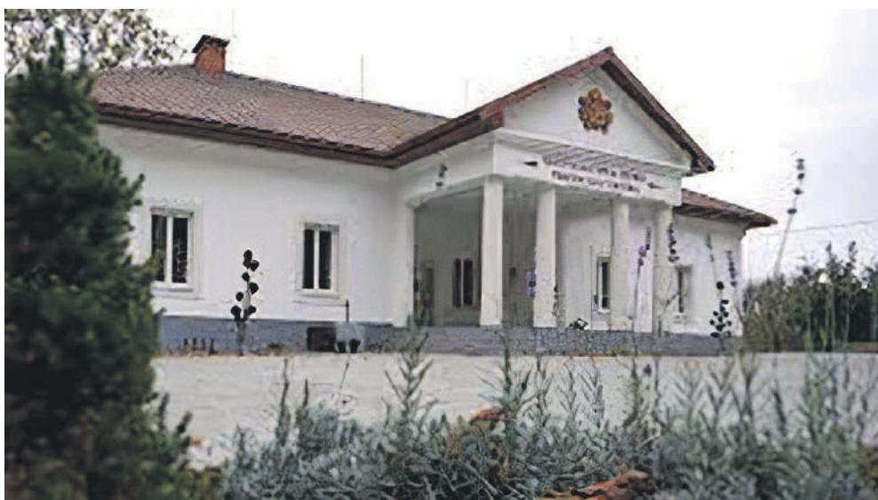
Perényi kastély (Beregárdó).