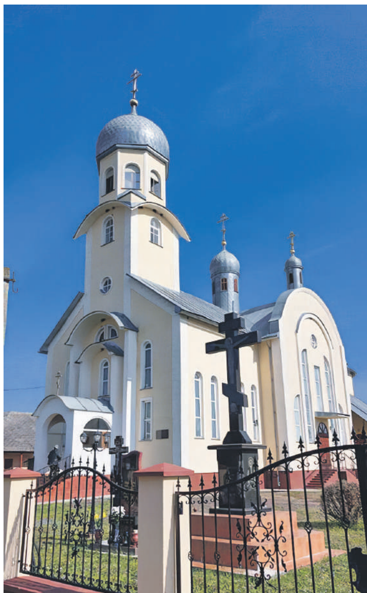
A tiszabökényi ortodox/pravoszláv templom