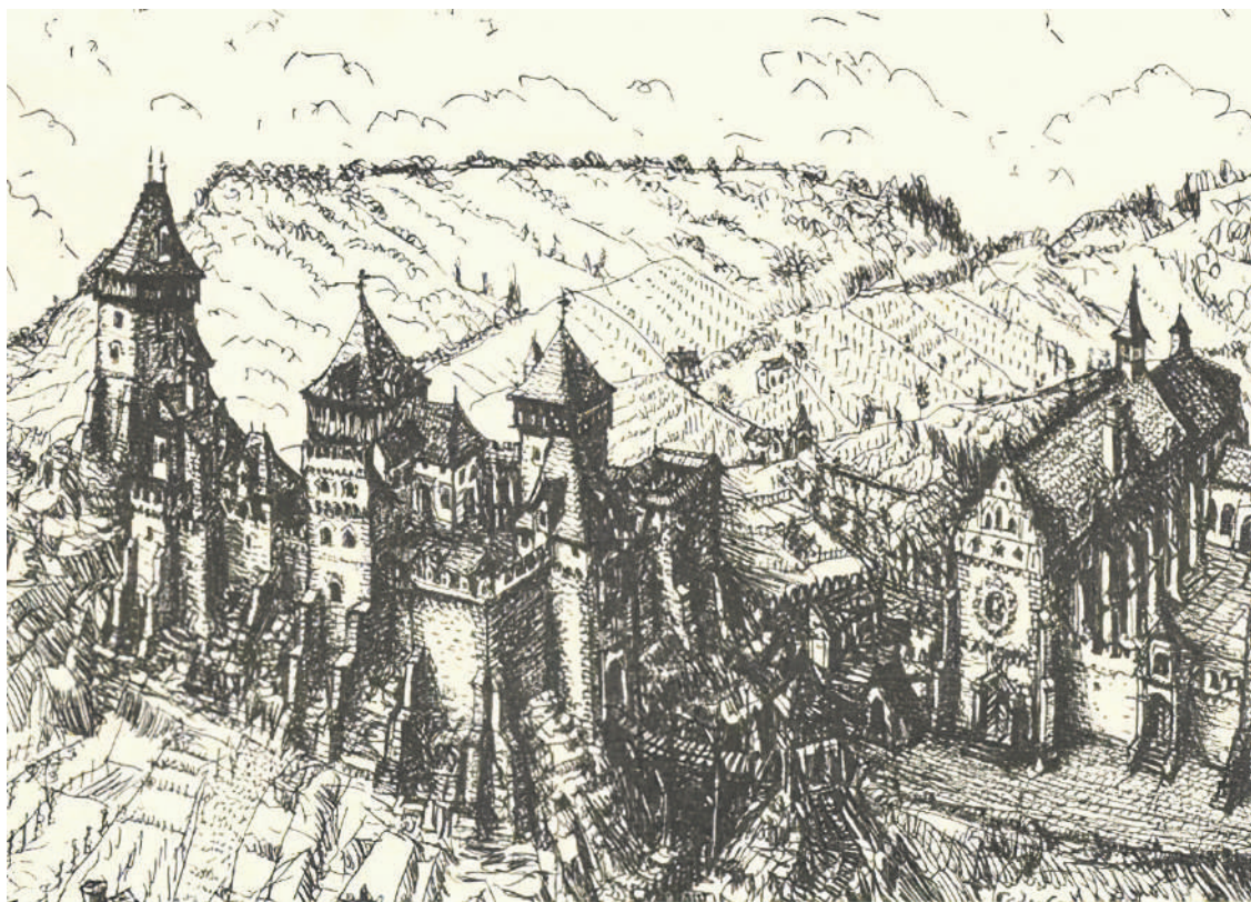
A Kankó-vár korabeli ábrázolása