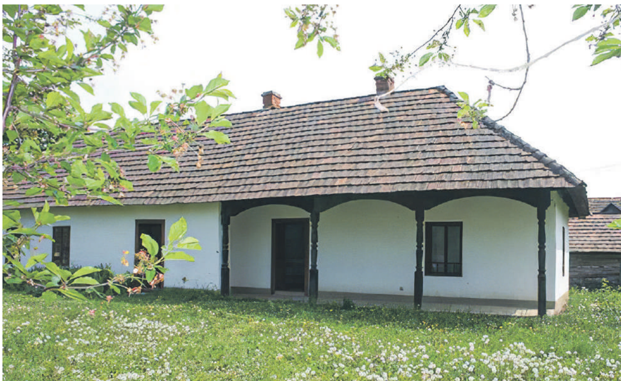
A falusi iskola a hozzá épült tanítólakkal a Tiszaháti Tájmúzeum területén