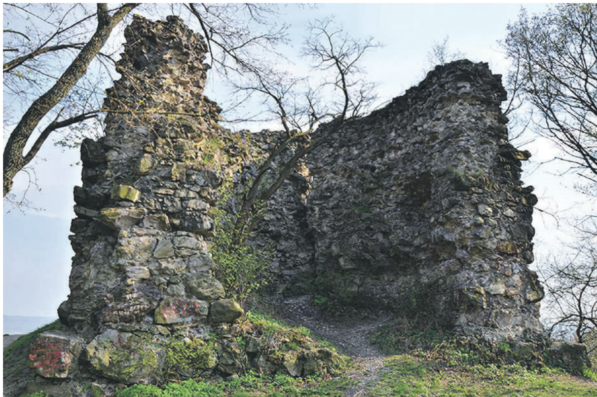
A királyházi Nyalábvár romjai