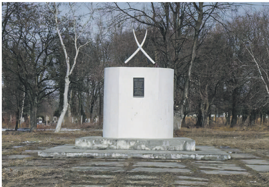
Emlékmű az 1703–1711-es Rákóczi-szabadságharc 91 falubéli kuruc katonájának

Árpád-kori, kismemesi vidék gócpontjának számító magyar lakta település, 1220-ban először Villa Petur , majd Peturfalva néven említik. A XIV. században a település vezető főura: Péterfalvy család . A birtokosok között nevezik meg a Szirmay , Bencze , Székely , Illés , Balogh és más családokat.