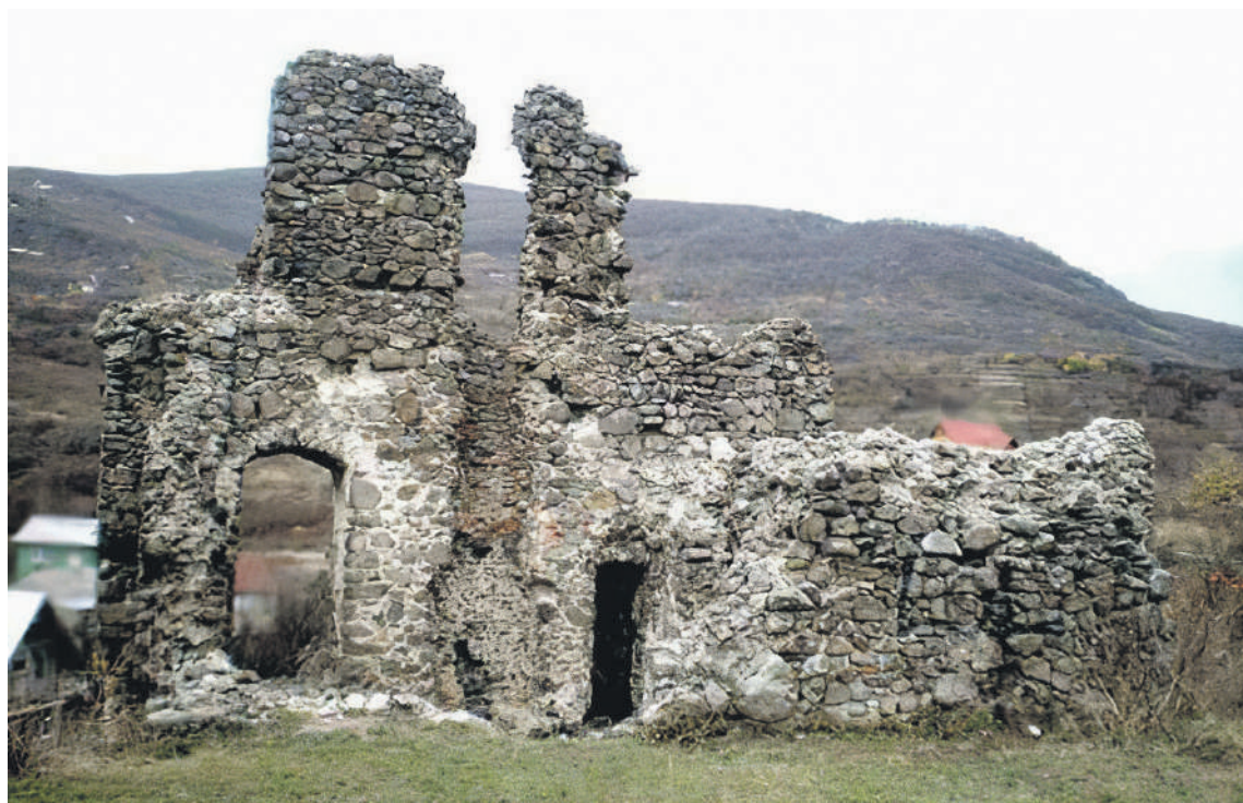
A nagyszőlősi Kankó-vár romjai