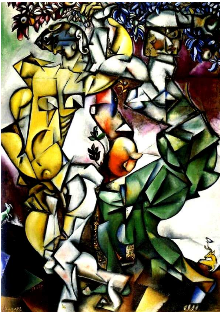
P. M. Chagall: Ádám és Éva , 1912