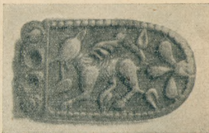
1. kép. Griffalakkal díszített szíjvég benepusztai honfoglaláskori magyar harcos sírjából. (M. N. M.)

Ezekből a szórványos adatokból is kétségtelen bizonyossággal következtethetjük, hogy az ősmagyarság körében a természetszemlélet bizonyos olyan magaslatot ért el, amely feltétlenül több, mint az egyszerű gyakorlati természetismeret. Ezt azért kell itt kiemelnünk, mert bizonyítani akarjuk,