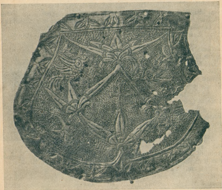
2. kép. A hitet jelképező kereszt és a gonoszt jelentő két sárkány aranyozott tarsolylemezen a vezérek korában eltemetett magyar harcos sírjából. A középen helyet foglaló kereszt és a kétoldali sárkány elhelyezése ugyanolyan, mint a román-kori templomok (pl. a jáki templom) oromdíszein. (M. N. M.)

hogy a magyarság természetszemlélete egyenes vonalban halad a fejlődés útján a finn-ugor korszak legelemibb kezdeteitől a keresztény román kor európai természetszemléletéhez a bolgár-török hatást mutató századokon át. A magyar művészettörténet már kimutatta, hogy a magyar románkori művészet az országban magyarrá lett, s egyenes folytatása a honfoglalók művészetének. Az arab-szasszanida palmetta és több más olyan motívum, amelyet a honfoglalók hoztak magukkal Levediából, ismételten felbukkan