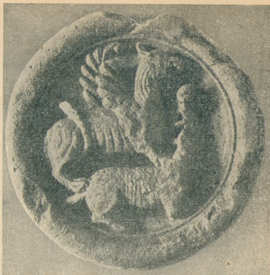
3. kép. A gonoszt ábrázoló állati szörnyetegen diadalmaskodó griff. Falkorong a XII. századból a székesfehérvári kőtárban. (M. O. B.)

A mai természetvizsgálót azonban mindezekon kívül fölöttébb érdekli, hogy a román kor magyar díszítő művészete sem topogott egyhelyben, hanem olyan fejlődést mutat, amelyből a természet egyre pontosabb megfigyelésére kell következtetnünk a magyarság körében is. A XI. század elején készült a legrégebb ismert magyarországi oszlopfő, amely Dömösről került a Nemzeti Múzeumba, az egész magyar plasztikának és románkori szobrászatnak első emléke. Oroszlánját nem nehéz felismerni, de a kicsiny,