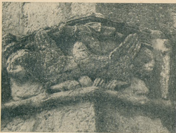
4. kép. Sárkánnyal viaskodó oroszlán vértesszentkereszti pillérfejezeten a XII. századból. (M. O. B.)