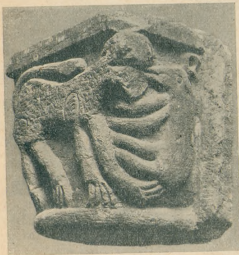
5. kép. Oroszlán. Oszlopfő Dömösről a M. Nemzeti Múzeumban. (M. O. B.)

A XII. század végén, mikor nyugaton már a gótika lengehajladozású naturalizmusa kezdte bontogatni csodás szépségű vonalait, nálunk is nagy erővel kezd bontakozni a naturalizmus, de még a román stílus körében. Különösen az esztergomi királyi építkezések tanulságosak e tekintetben. Micsoda pompás természeti megfigyelés él pl. abban a sasban, amely az esztergomi bazilika díszkapujának falát díszíti (54. tábla, 1. kép). Az esztergomi királyi