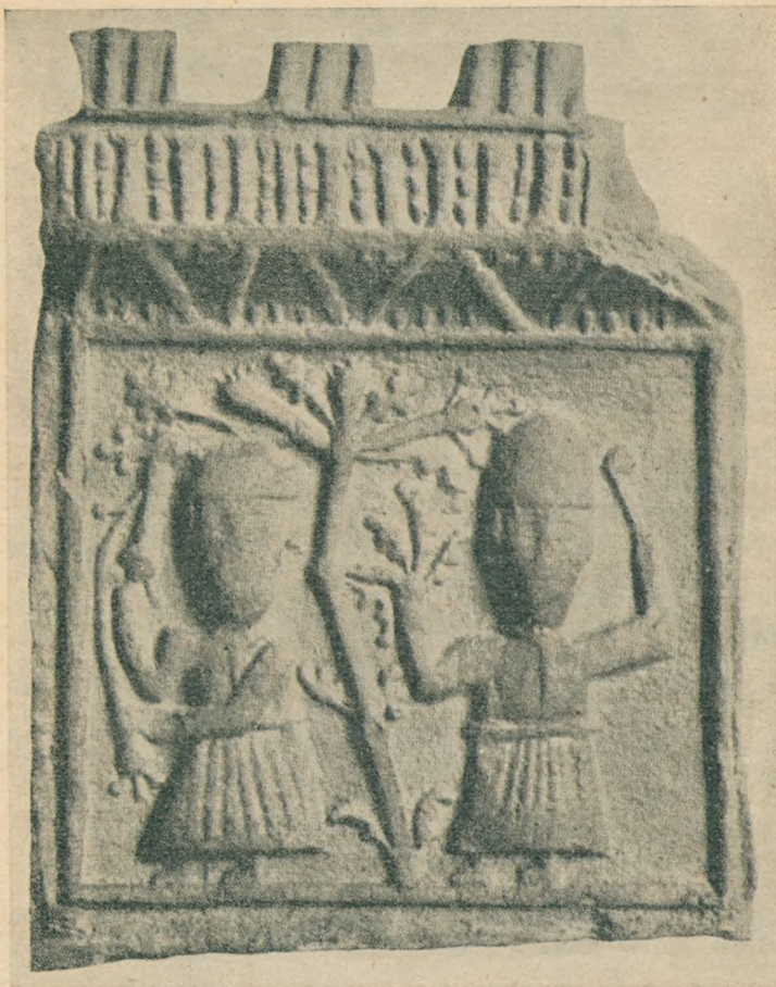
6. kép. Makkot verő pásztorok a nadabi kályhacsempe-töredéken.

A magyar természetszemlélet kezdetei arra tanítanak, hogy egyenes és megszakítatlan fejlődéssel jutott el a magyarság művelődésének fejlődésével kapcsolatban az ősi finn-ugor korszak kezdetéből a török-bolgár hatáson át az európai keresztény középkorba, s emelkedett a középkor jelképes természetrajzi szintjére. Nyugaton a XII. században első virágkorát éli a középkori természetrajz ALBERTUS MAGNUS, CANTIMPRÉ THOMAS