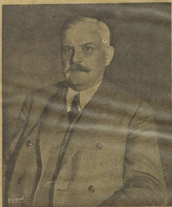
DI Dr. IOAN SUCIU fost ministru, fost deputat în parlamentul ungar, organizatorul Reg. Horia.