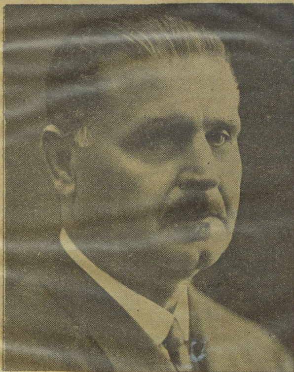
Dr. Vasile Goldiș, ministrul cultelor.