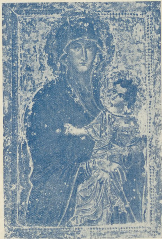
2.) A Rómában lévő Maria Maggiore-i Havi Boldogasszony-kép, fára festve.