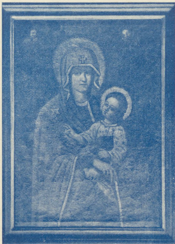
1.) A makói sz. István-plébániatemplom „Havi Boldogasszony“ képe. (Méret: 87x122 cm.)