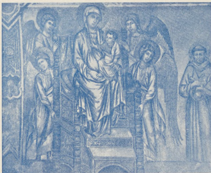
3.) Cimabue Madonnája Assisiben sz. Ferenc alsó templomában, falra festve.

(P. Kuhn : Kunstgeschichte, Malerei, I. k., 396. kép.)