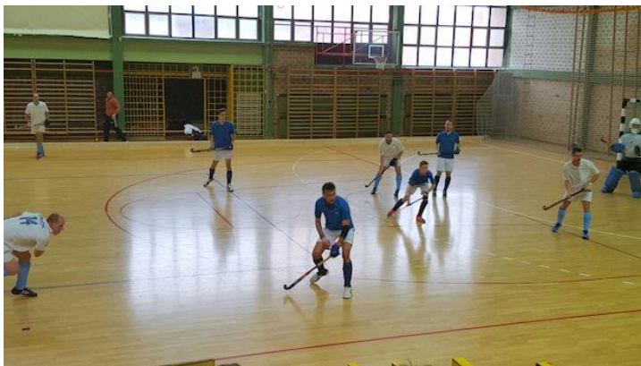
Nemzetközi teremtorna egyik mérkőzése Sveti Ivan Zelinában 2015-ben

1972-ben volt a gyephoki teremben, kézilabdapályán, hat fős csapatokkal játszott új változatának hivatalos bemutatkozása. Ez a verzió mind a játékosok, mind a nézők körében gyorsan népszerű lett. Az előbbiek között azért, mert télen is lehetett játszani, a nézők számára pedig gyorsabb, látványosabb, jobban követhető játéknak bizonyult. Először 1974-ben a férfiak, majd 1975-ben a nők számára rendeztek teremhoki Európa-bajnokságot.