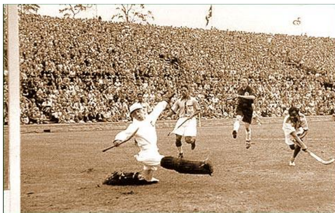
Németország - India mérkőzés az 1936-os berlini olimpián