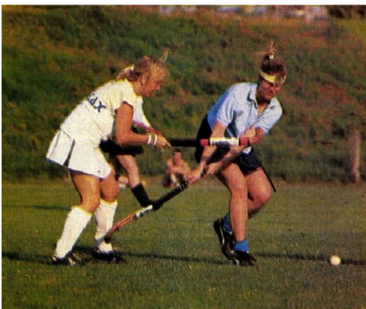
Novitax – Tabán női mérkőzés 1987-ben

aki hajlandóságot mutatott nevet adni és némi anyagiakat ránk szálni.” Tehát a kecskeméti Delikát SC tulajdonképpen csak nevet adott egy budapesti női gyeplabdacsapatnak, amely egyébként a MAFC sporttelepén tartotta edzéseit, és – más lehetőség hiányában – a fiú ifjúsági bajnokságban indult el. Ez a különös házasság aztán nem tartott sokáig, mert a hölgyek hamarosan Budapesten is találtak olyan egyesületet – a Movill Sport Clubot –, amely felkarolta a női gyeplabdát. 1987-ben már a Tabán SC és a Novitax Spartacus SE is rendelkezett női csapattal, amelyek nagypályán és teremben egyaránt játszottak nemzetközi meccseket is, még hozzá nem is eredménytelenül. Ezzel a magyar női gyeplabda szelleme megállíthatatlanul kiszabadult a palackból és szerencsére azóta is színesíti sportéletünket.