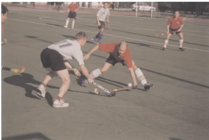
Építők - Rosco műfüves bajnoki mérkőzés 2000 körül

Ezt azért fontos hangsúlyoznunk, mert a magyar gyeplabdáról szóló írásokban a '90-es évekről általában méltatlanul kevés szó esik. Pedig a tények alapján, erről az időszakról szólva egy olyan történet bontakozik ki a szemünk előtt, amelyre a sportág minden kedvelője méltán lehet büszke.