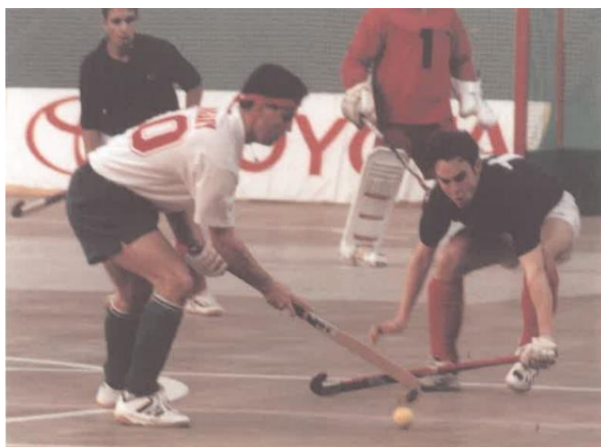
Magyarország - Franciaország mérkőzés a Portóban rendezett terem EB-n 1999-ben