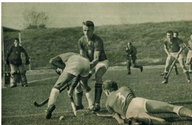
Magyarország - Olaszország válogatott mérkőzés 1966-ban

1957-től a szövetség nagy erőket mozgósított, hogy a magyar gyeplabda újra bekerüljön a nemzetközi vérkeringésbe. Kilencéves szünet után, 1958-ban játszhatott újra hivatalos mérkőzést a magyar válogatott. Az ellenfél Lengyelország volt, a végeredmény 7:0-ás vereség. A '60-as években a válogatott váltakozó sikerrel szerepelt, de ebben az időszakban is születtek kiemelkedő eredmények. A legnagyobb sikert 1966-ban könyvelhette el a magyar gyeplabdacsapat. A válogatott óriási meglepetésre megnyerte a Torinóban megrendezett négy csapatos nemzetközi gyeplabdatornát, a Zovato-kupát. A magyar csapat Belgiummal 1:1-es döntetlent játszott, Olaszországot 1:0-ra, Portugáliát pedig szintén 1:0-ra győzte le.