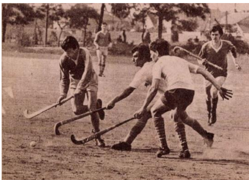
Kinizsi Sörgyár - Bp. Postás bajnoki mérkőzés salakon 1971-ben

így jól hangzik, a probléma viszont az volt, hogy egyik helyszín sem volt igazán alkalmas gyeplabdázásra. Ezek lényegében focipályák voltak, viszont a gyephoki számára legideálisabb az úgynevezett „birkarágta gye” volt (ezt a „szakkifejezést” külön köszönöm Ferenczi Ferencnek, az MGYSZ jelenlegi alelnökének). Ez az egészen rövidre lenyírt fűvet jelenti, rövidebbet, mint ami a focipályákon szokott lenni. Azt is hozzá kell tennünk, hogy a játékosok gyakran már annak is örültek, ha egyáltalán fűvet találtak a játéktéren, mert többségében – mint a Népstadion edzőpályája – salakos borításúak voltak.