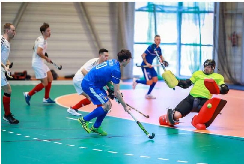
Magyarország - Olaszország mérkőzés a budapesti férfi terem EB-n 2024-ben