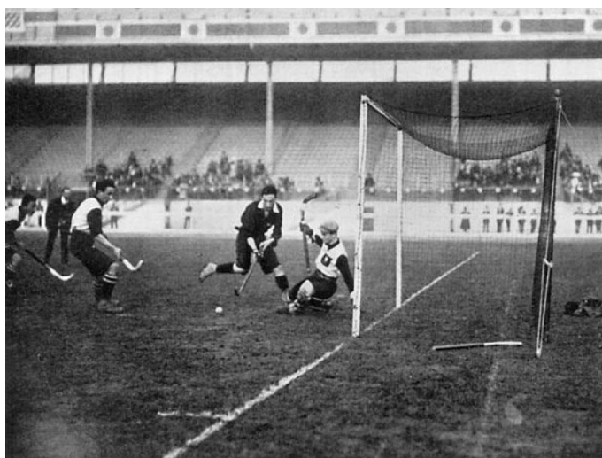
Skócia - Németország mérkőzés az 1908-as londoni olimpián

verziót favorizálták. A következő olimpiát pedig elsodorta az első világháború. 1920-ban az antwerpeni játékokon újra megrendezték a gyeplabdatornát is, igaz a németek nélkül, hiszen a világháborúban vesztes országok ezen az olimpián nem vehettek részt. Így négy válogatott nevezett a megmérettetésre és aligha meglepő, hogy az első helyen Nagy-Britanniát találjuk, immár csak egy csapattal. A többi helyen sorrendben Dánia, Belgium és Franciaország osztozott.