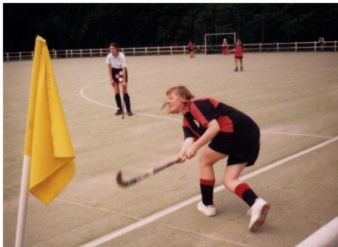
Standard Athletic Club - British School of Paris női műfüves mérkőzés 1996-ban