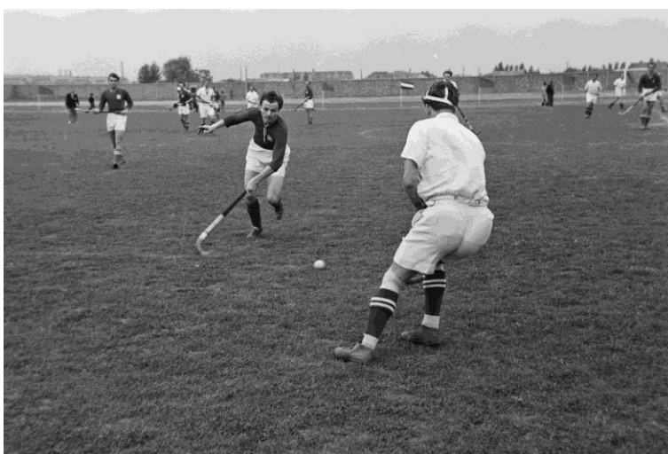
Magyarország - Csehszlovákia válogatott mérkőzés 1949-ben

időre ez lesz a nemzeti csapat utolsó fellépése. Sőt a gyeplabda hívei hamarosan kénytelenek voltak rájönni, hogy az élet valóban nem habos torta, mert szép lassan a legtöbb sportegyesületből – felsőbb nyomásra – kiszorították a gyephokit. 1954-ben már csak négy csapat indult a bajnokságban, majd a következő évben a Bp. Kinizsi és a Bp. Szikra is megszüntette a gyeplabda-szakosztályát. 1956-ra már csak két egyesület maradt, ahol még létezett gyeplabdacsapat: a Bp. Építők és a Törekvés. Így ebben az évben a bajnokságot sem tudták kiírni. Úgy tűnt Magyarországon a gyeplabda sírba szállt.