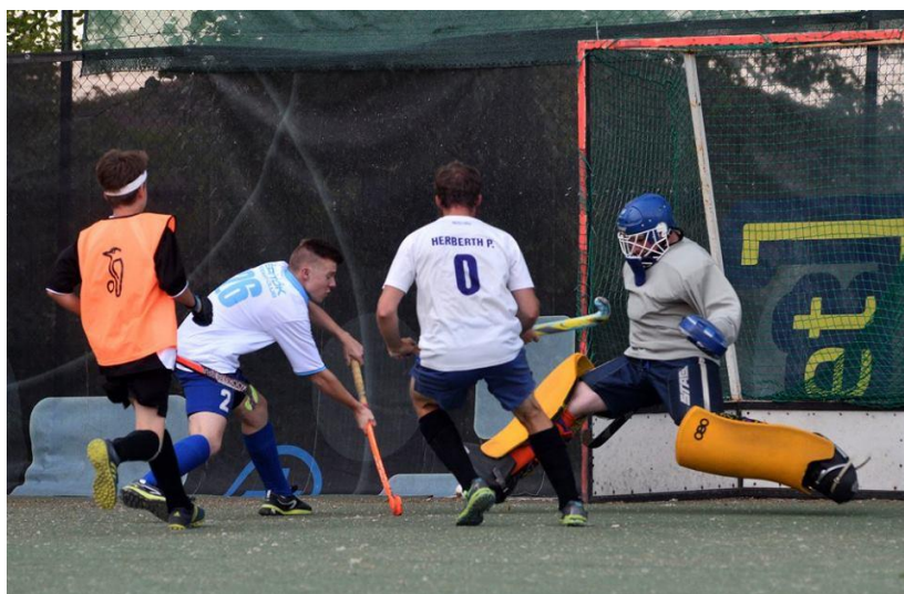
Főnix - Építők mérkőzés a HOLI5-ös bajnokságban 2017-ben

Szintén 2017-ben indult el az úgynevezett HOLI5 bajnokság, mely az országban elsőként alkalmazta a kispályás "Hockey5s" szabályrendszerét. A bajnokság a Főnix MSE gyeplabda-szakosztályának szervezésében indult le, majd annak megszűnése után a Piros-Fehér Hockey Club vette át a stafétabotot. Ennek a szabadtéri, kispályás bajnokságnak a magyar viszonyok között különösen kiemelt fontossága lehet, hiszen kis létszámú csapatok is játszhatják (vegyes férfi-női felállásban is), és akár egy iskolai műfüves pálya is helyszínül szolgálhat. Mind az idősebb, mind a fiatalabb játékosok számára szórakoztató és sikerélményekben gazdag lehetőséget kínál a sportág gyakorlására.