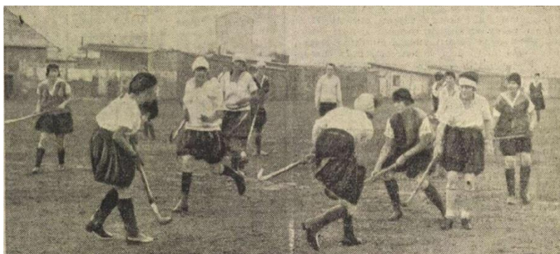
Az első női mérkőzés Magyarországon a MAC és az MHC csapatai között 1925-ben