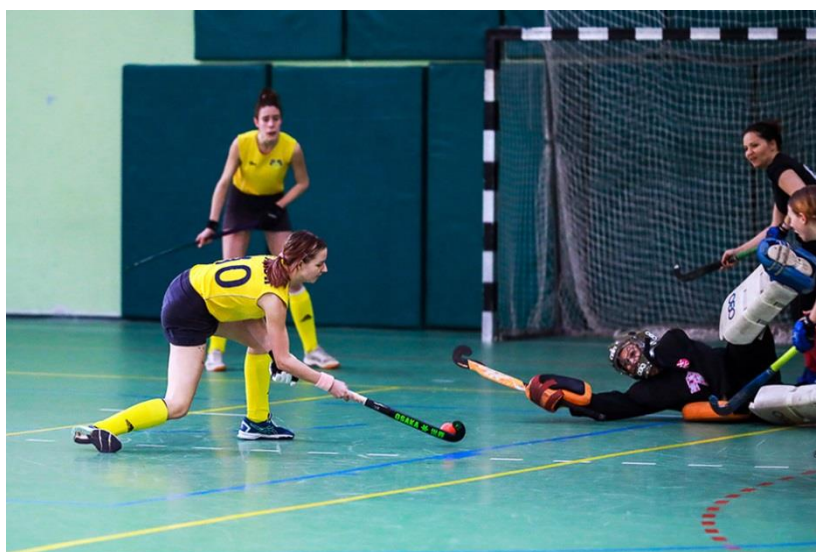
Amatőr HC - BKGDSE-Fasor női teremhajóknoki mérkőzés 2024-ben

A női bajnokságra – egy népmesei fordulattal élve – azt mondhatnánk, hogy hol volt, hol nem volt. A 2000-es évek elején volt, amikor megrendezték a nagypályás és teremhajóknokságot is, volt, amikor csak teremben játszottak a hölgyek, és volt, amikor semmilyen bajnokságot sem írtak ki. Mindez nyilván attól függött, hogy éppen aktuálisan mennyi női csapat üzte aktívan a sportot. Amikor nem került sor a magyar bajnokság kiírására a működő csapatok akkor sem pihentek, hanem különböző nemzetközi tornákon vettek részt, ezzel is életben tartva a női szakágot. Üde színfolt volt ebben az időszakban, hogy egy főleg helyi jégkorongozókból álló kazincbarcikai csapat is szerepelt néhány alkalommal a teremhajóknokságban. 2015 óta már rendszeresen megrendezésre kerül a női bajnokság is teremben és műfűvön is – utóbbiban igaz csak szűkített formátumban, de 2022-től már háromnegyed pályán 9 fős (8+1-es) csapatokkal – ahol az Amatőr HC sorozatban gyűjtötte be a bajnoki címeket mind nagypályán, mind teremben. Ezt a szériát előbb a Szent László csapata tudta megtörni a 2022/23-as műfűves bajnokságban, majd a 2023/24-es szezonban a BKGDSE-Fasor HC együttese a nagypályás és a teremhajóknoki címet is elhódította.