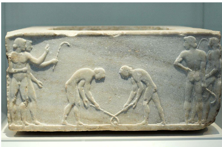
Görög dombormű a keretizontes nevű labdajátékról, Kr.e. 510 körül

Vagyis a kezdetekről szólva egy dolgot biztosan tudunk: azt, hogy nem tudjuk kik voltak az elsők. Viszont az is biztosnak tűnik, hogy a labdával és ütővel folytatott különböző csapatjátékok a világ több pontján – gyakran egymástól függetlenül – már az ókorban kialakultak.