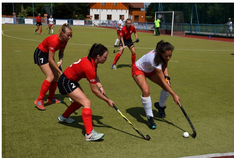
Litvánia - Magyarország mérkőzés a szlovéniai női EB-n 2019-ben