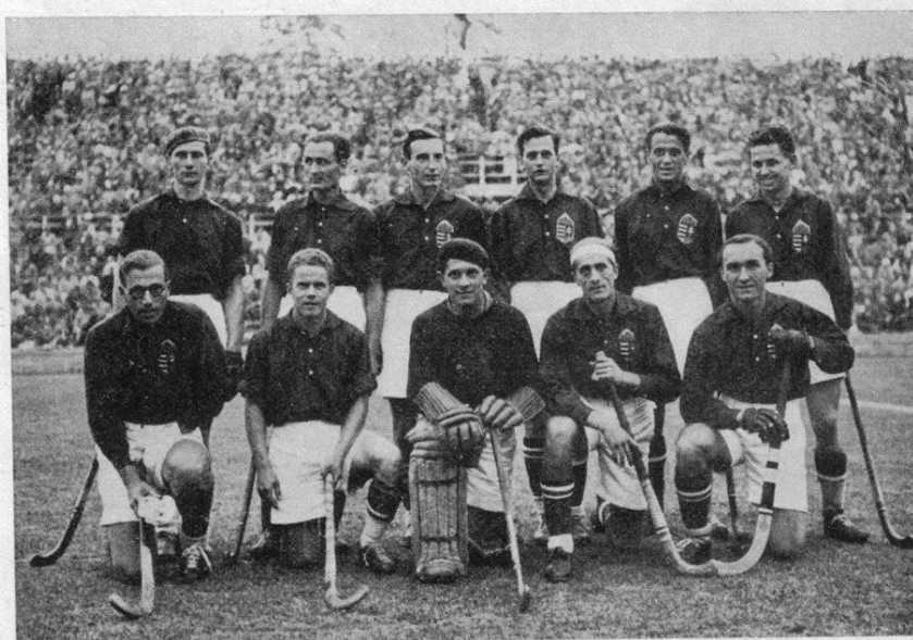
A magyar csapat tagjai.

tudósítások szerint a magyar csapat nem játszott rosszul, a meccs egyes szakaszaiban még fölényben is volt, azonban a gólokat mégis a japánok ütötték, melyekre csak egy válasz érkezett. A végeredmény 3:1-es japán győzelem. A magyar játékosok számára ez egyértelműen fájó vereség volt. 1936. augusztus 10-én került sor a Magyarország-USA mérkőzésre, mely végre meghozta a várva várt győzelmet. A magyar csapat jó játékkal 3:1-es győzelmet aratott. Sajnos ez kevés volt a csoportból való továbbjutáshoz, így már csak egy helyosztó mérkőzés maradt hátra, melyet Belgium ellen kellett megvívni. A magyar válogatott 1:0 arányban győzött, ennek ellenére nehéz megmondani, hogy hányadik helyen végzett. A helyosztókat az 5-11. helyekért játszották és különböző számítások vannak arra nézve, hogy melyik csapat milyen helyezést ért el. A legmértvadóbb talán a Nemzetközi Olimpiai Bizottság, melynek hivatalos weboldala szerint Magyarország holtversenyben a 7. helyen végzett. (A Magyar Olimpiai Bizottság honlapján annyi szerepel, hogy helyezetlen.)