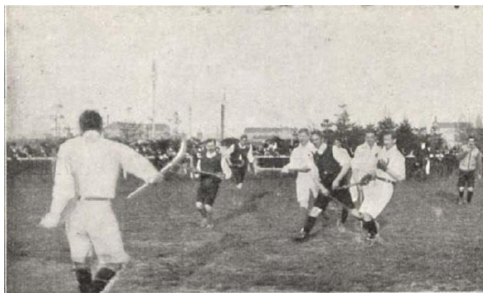
Az első hivatalos gyephoki meccs Budapesten 1907. május 05-én