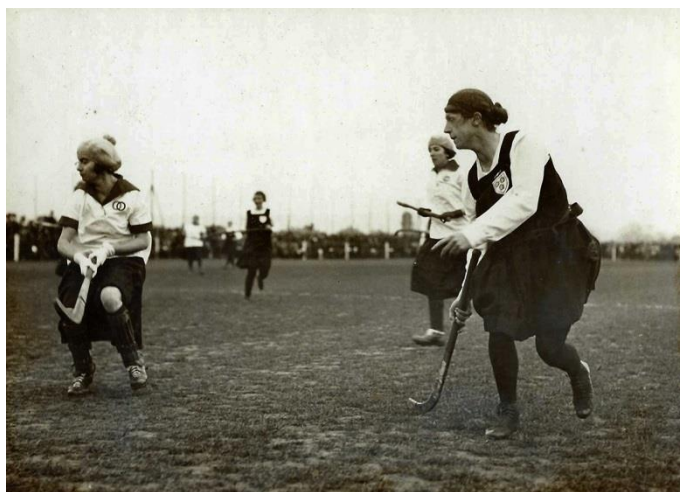
Anglia - Franciaország női válogatott mérkőzés 1923-ban

A következő fontos esemény az 1927-es évhez kapcsolódik, amikor a hölgyek is létrehozták saját önálló szervezetüket, a Nemzetközi Női Gyeplabda Szövetséget. (International Federation of Women's Hockey Association, röviden: IFWHA). Az alapítók között ott találjuk Ausztráliát, Dániát, Angliát, Írországot, Skóciát, Dél-Afrikát és az USA-t. Ezekben az országokban máig rendkívül népszerű a női gyeplabda. Példának okáért 1968-ban a londoni Wembley stadionban 60 000 néző(!) volt kíváncsi az Anglia-Hollandia női gyephoki meccsre. Az USA-ban pedig mind a mai napig kifejezetten női sportágnak tartják. Az IFWHA 1983-ig működött önálló szervezetként, amikor beolvadt a FIH-be.