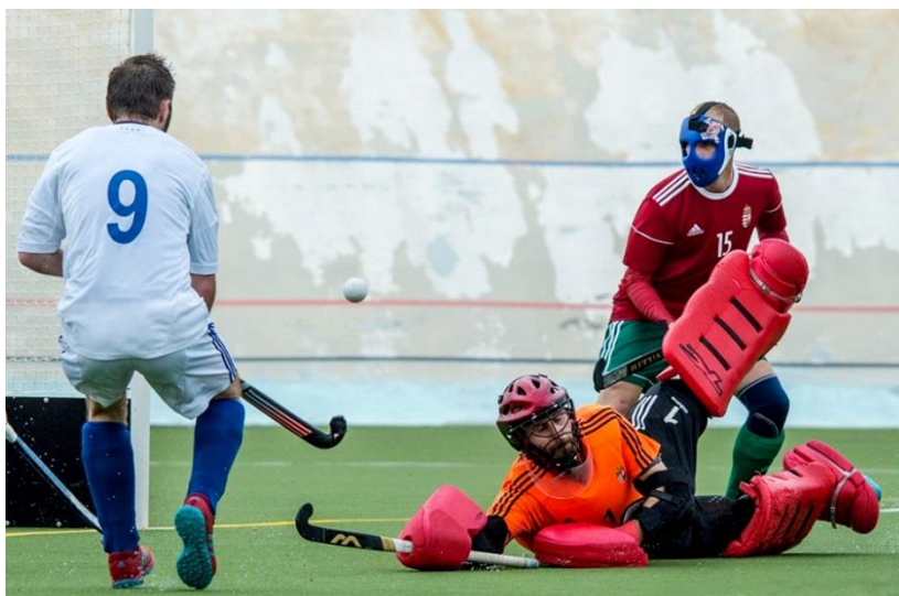
Finnország - Magyarország mérkőzés a finnországi férfi EB-n 2019-ben