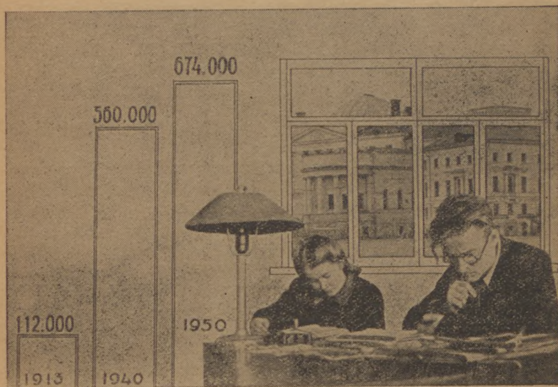
A főiskolai hallgatók számának növekedése.

betörése nagy rést ütött, ennek helyrehozatala sok időt igényel). Öt év alatt a szovjetfőiskolák kb. egymillió, a műszaki tanintézetek kétmilliószázezer embert bocsátanak ki; szakemberekből 2 milliót, középfokú szakképesítéssel több mint 600.000-t. E tömeg 25 százaléka az iparban és fölépítésben fog dolgozni. A középfokú képesítést nyertek közül kb. 350.000 középfokú specialista a technikumok tanulóit fogja előkészíteni. Ilyképen az