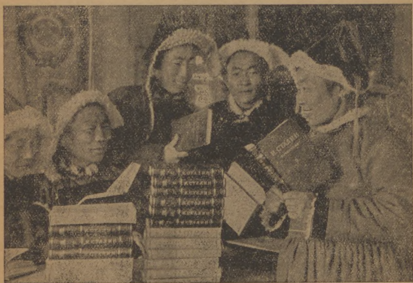
Burját-Mongólia könyvkereskedéseibe megérkeznek Sztálin művei.

Ami a sajtót illeti, 1913-ban 859 újság jelent meg, s ebből 775 orosz nyelven. 1938-ban pedig 8850 újság s ennek több mint negyedrésze 70 különböző, nem-orosz nyelven. A példány-