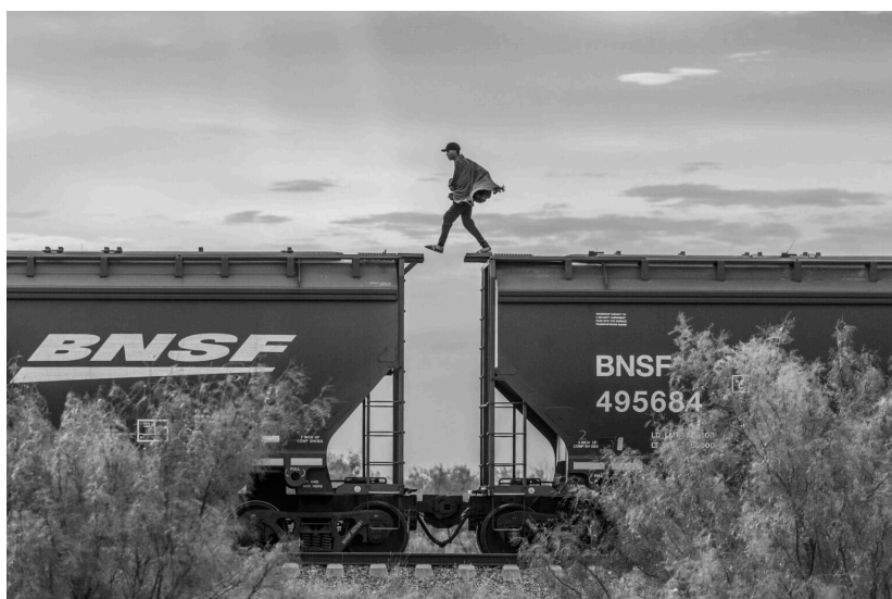
Fotó | Alejandro Cegarra