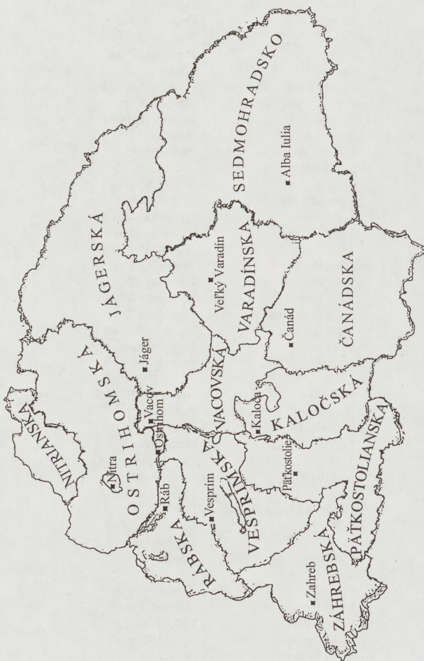
Diecézy Uhorska v 14. storočí