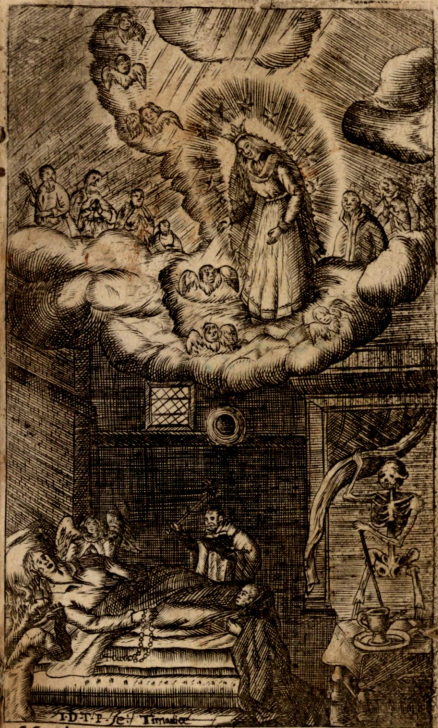
Maria Mater Agonizantium.