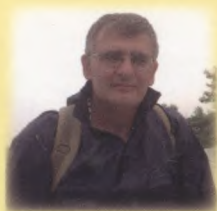
CSONTOS JÁNOS (Ózd, 1962 – Budapest, 2017) József Attila-díjas költő, író

Csak a lélek, mi hű marad: a matéria pusztá póz. Szájöblödben a műanyag, fogaid közt a cellulóz.