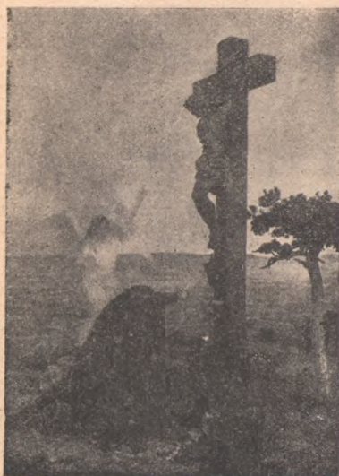
„Miattam. — Értettem; Bűneim miatt, üdvömrért tört meg e szív!”

határozott feltételemet megtarthassam a mi Urunk, Jézus Krisztus által. Amen.”