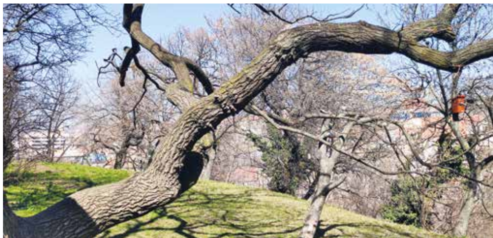
Tabáni tavasz, 2022

(Kosztolányi Dezső: Budai idill – részlet)