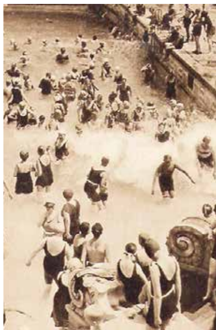
A Gellért fürdő a 30-as években

(...) A hatalmas római birodalom a keletről támadó barbár népek ellen őrtornyok láncolatával védekezett a Duna mentén. A mai Budapest területén, a Margitszigeten, a Gellért-hegyen, Tabánban, a Rákospatak torkolatánál, az Országház környékén álltak a római őrtornyok. A Március 15-e téren a Contra-Aquincum nevű castrum (erősség) a dunai átkelést biztosította.”