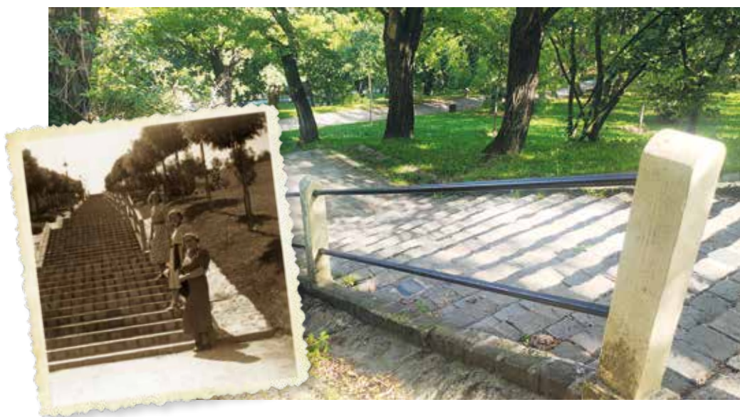
A Kőműves lépcső 1940-ben és napjainkban.