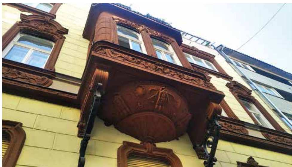
Gellérthegey utca 25: néhány házra a Tabántól, a Naphegy egyik büszkesége az épület.