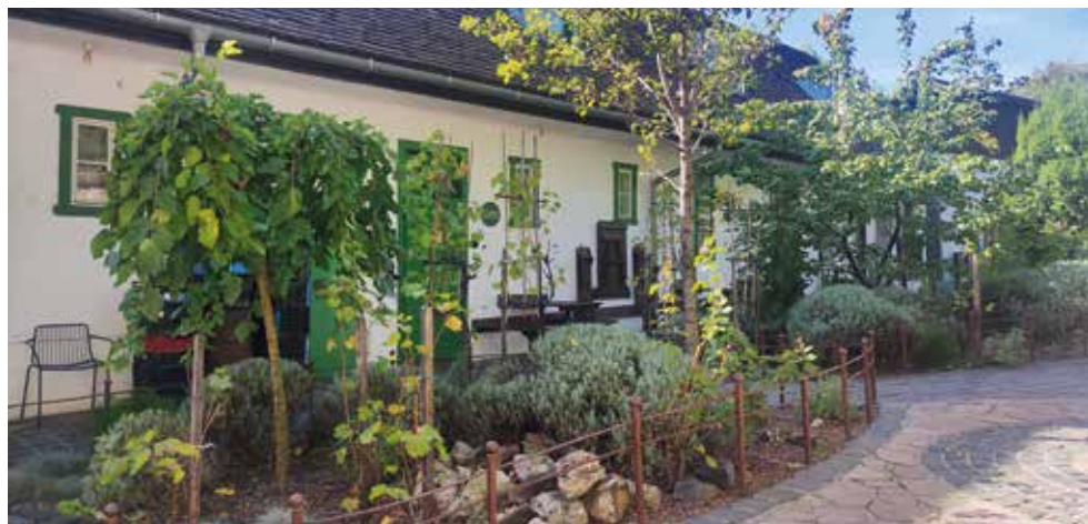
Az ősi Tabán utolsó emlékeinek egyike, ahol ma újra piac működik a Czakó-kert