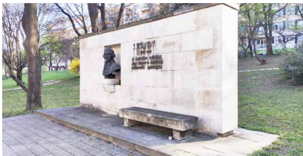
Haydn mester emlékműve a Horváth-kertben

példátlan látványosságnak számító előadást hetvenszer játszották Molnár címszereplésével, aki 1848/49-ben maga is honvédként szolgált.