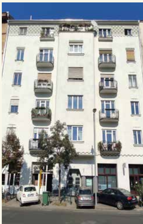
Az Attila út 35. régen és a 37-es napjainkban.

világosabb, amelybe azután mintákat karcolnak.) A vakolatdíszek a Tabán hajdani lakóit, szerbeket, svábokat, magyarokat láttatták. No és ki ne ismerné a második világháborúban ide becsapódó német teherszállító vitorlázórepülőgép igazmeséjét?