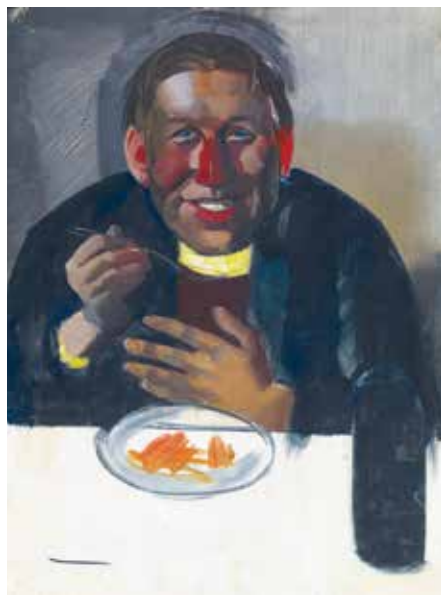
Aba-Novák Vilmos: Berda