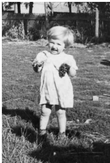
„S arra ébredünk fel reggel / Napsugaras nyár van” (Zelk Zoltán)