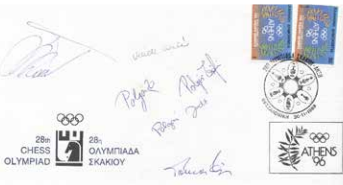
Postabontás. A magyar női válogatott a szovjet (grúz) hegemoniát megtörve nyert sakkolimpiát Szalonikiben.