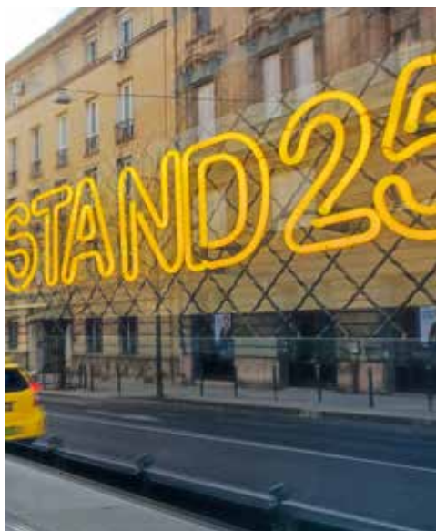
... de megjelentek már a tabáni vendéglátást újragondoló éttermek is, mint a Marischka vagy a Stand 25 Bisztró.