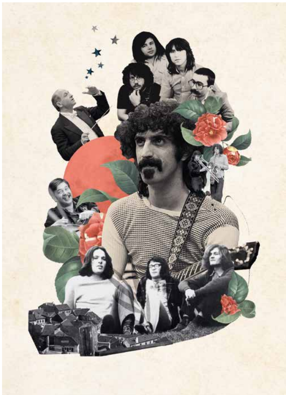
Kistelegi Dóra illusztrációja