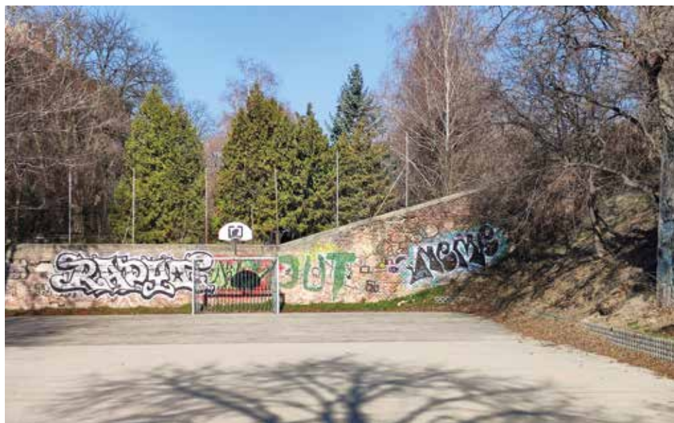
Petőfi-pálya, Váralja utca