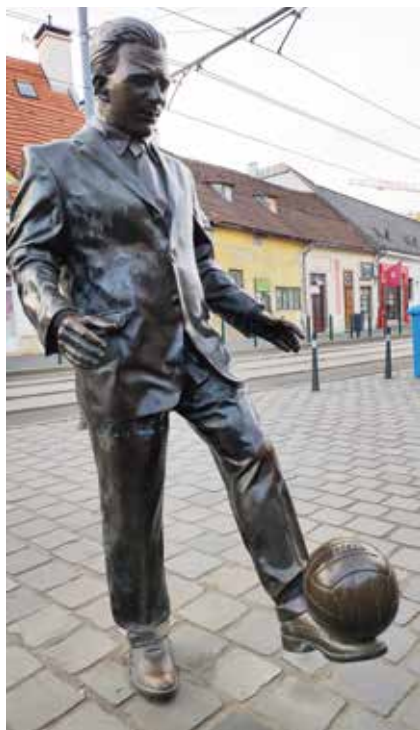
Puskás „Öcsi” szobra az Óbudai promenádon (Pauer Gyula és Tóth Dávid alkotása)