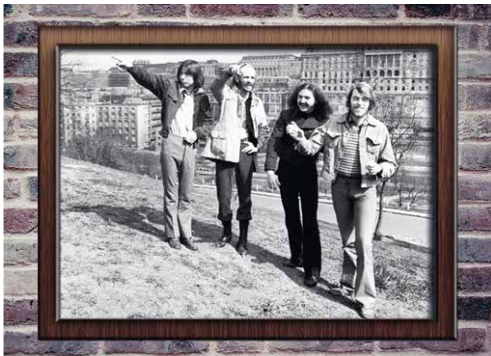
A legendás Taurus zenekar a Tabánban. A képen jobbról a második: az istenített Radics Béla (1946-1982).

Kiderül, a kamaszévekben – a korszellemnek megfelelően – ő is zenekarban játszott, mégpedig dobosként; a bőrkötőt a Márvány utcában püfölte talán a legtöbbet. Moziba az Ugocsába járt. A lázadás képes tablóját, az Eper és vért is itt látta, s mint mondja, „elraktározta magában” ezt a kivételes filmet, Stuart Hagmann alkotását. Azután újabb, az életét befolyásoló mozgóképet említ: Zeffirelli Romeo és Júliáját . Az Ugocsa mellett további három budai filmszínházról beszél úgy, mint inspiráló kultúrcentrumról: a Krisztina körüti Diadalról (Tabán néven élte túl a rendszerváltást), a Bartók Béla úti Bartókról (megszűnt!), és az Alkotás utcai Alkotásról (megszűnt!).