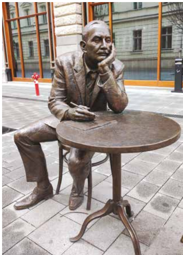
2021-ben az Erzsébet híd túloldalán, a Duna utcában, a Tabántól 10 perc járásra avatták föl Krúdy Gyula legújabb budapesti köztéri szobrát.

Torkon akadt sóhajtáshoz hasonló kéményfüstök, föld alatti, tetszhalottéhoz hasonló nyögések, a varrógép pergésébe fulladt zokogások, holdvilágnál született csalékony és a nappali világosságnál hirtelen megöregedett s tehetetlen álmok, nevüket is elfelejtett bánatok, céltalan csavargások és még céltalanabb üldögélések hazája, Tabán! – itt történt, hogy Mariancsics Lenke, aki olyan szőke volt, mint az újhoid, és a kocsmák falevéllal tarkított lugasaiba, egyhangúan zümmögő nótáktól remegő ablakaiba évekig égboltozat-kék szemével bepillantgatott, hogy alvó ismerőseit felébressze a bormérések sarkaiban való elátkozottságukból (...) Hegynek kanyargó és kiismerhetetlen végzetű utcák, már csak botlásra való kapuküszöbök, megbetegedett ajtók, amelyek szinte leestek helyükről, amint idegen kéz nyúlt hozzájuk, nagymamák és még régebbi emberek idejében új szobabútorok, fájdalomra sóványodott kanapék, köszvényes székek, régi arcokat mutogató,