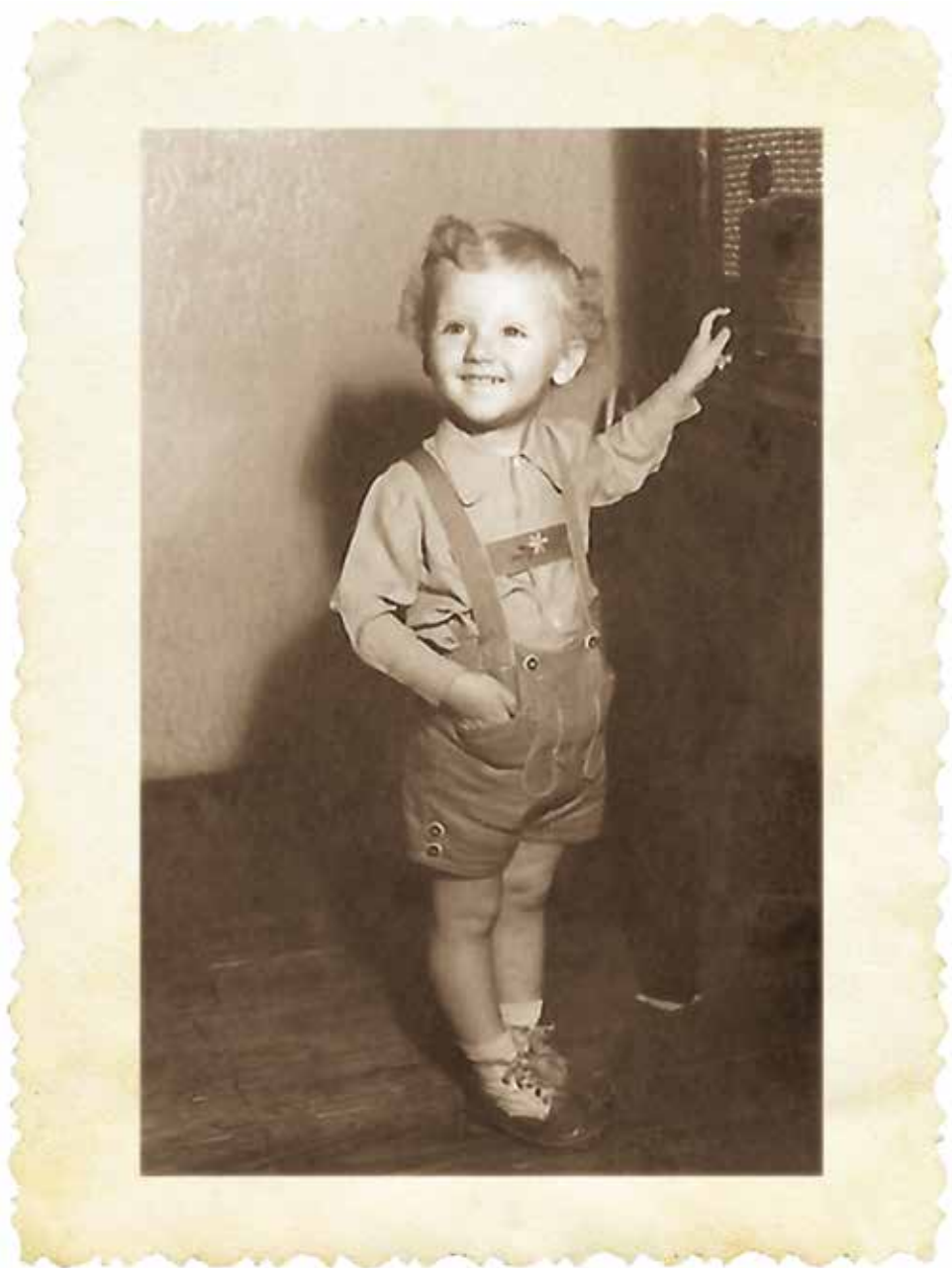
Tabáni mosolyalbum, 1940-es évek. „Pedig amint fogy-fogy a jövődő, / egyre-egyre drágább lesz a múlt” (Babits Mihály).