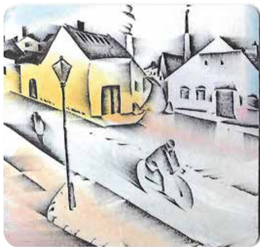
Sőralátétén Molnár-C. Pál: Hadnagy-utca a Tabánban (1924) művének egy részlete