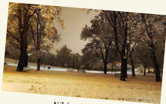
Néhány órára hó lepte be a Tabánt 2023. december 23-án

Tabán – odaveszett éden Tabán – a kettétört szívben Tabán – a remény rabja Tabán – Zöldfa , vadkan Tabán – múlt és jelen Tabán – tűzvész szerelem Tabán – piruett a jégen Tabán – örökké ébren? Tabán – flipper platán csevej Tabán – lányok illatos blúza Tabán – villamoson utazó múzsa Tabán – harangszó és blues