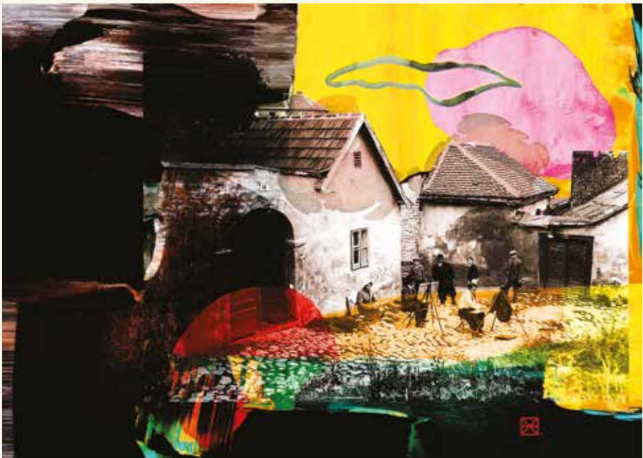
Zilahi Nono: Tabáni anziks sz I-II.