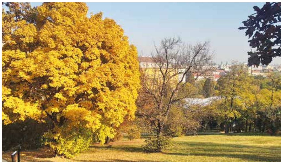
Október a Tabánban 2021-ben, a háttérben a Bethlen-udvarral, az Erzsébet híddal és a „messzi” Pesttel

„A Várhegy meredek lejtőivel a Duna és a Vérmező között 167 méter magasságban emelkedik. A hegy agyagos és meszes elegyrészekből álló üledékes kőzetét jégkorszaki Duna-kavics és 10 méter vastagságú mésztufa takaró borítja. A mésztufa lerakódásakor egymással össze nem függő üregek egész sora keletkezett. A középkorban a több mint 200 barlangüreget mesterségesen összekötötték, és így kialakult a mintegy 10 kilométer hosszúságú Várbarlang-rendszer, amelynek azután történelmi szerep is jutott. A barlang labirintusában több tucat ásott kút található, amelyek háborús időkben a Várnegyed lakóinak vízszükségletét biztosították. A Várbarlangot korábban »Török pincéknek« neveztek Buda lakói.” (Tihanyi János: Séta Budapesten, részlet)