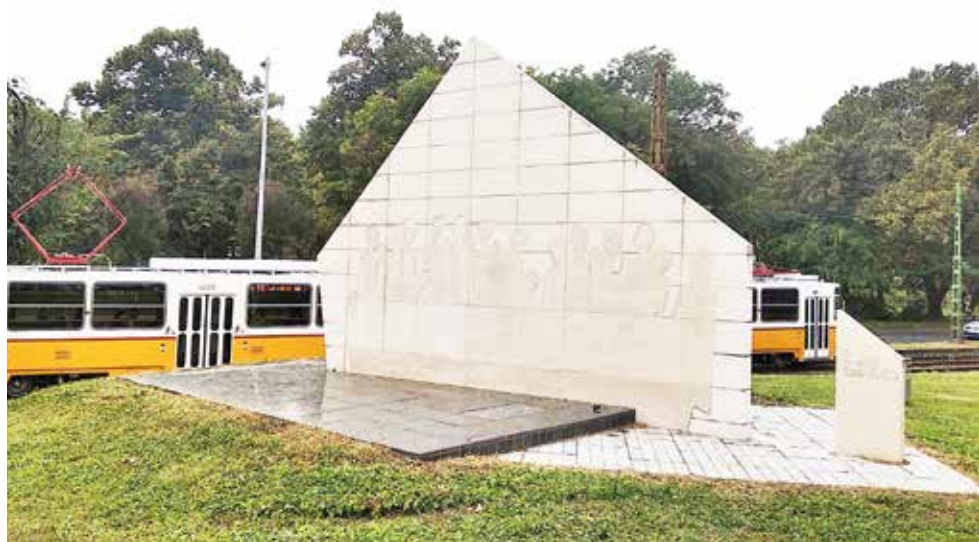
A kitelepítettek emlékműve