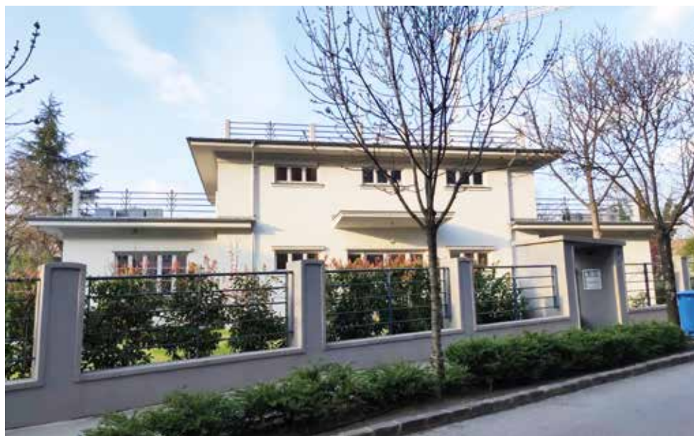
A régi MTK felújított fogadóépülete az Aladár utcában. A munkagépek a Tigris utca menti salakos tenispályákat egy évtizede tüntették el...