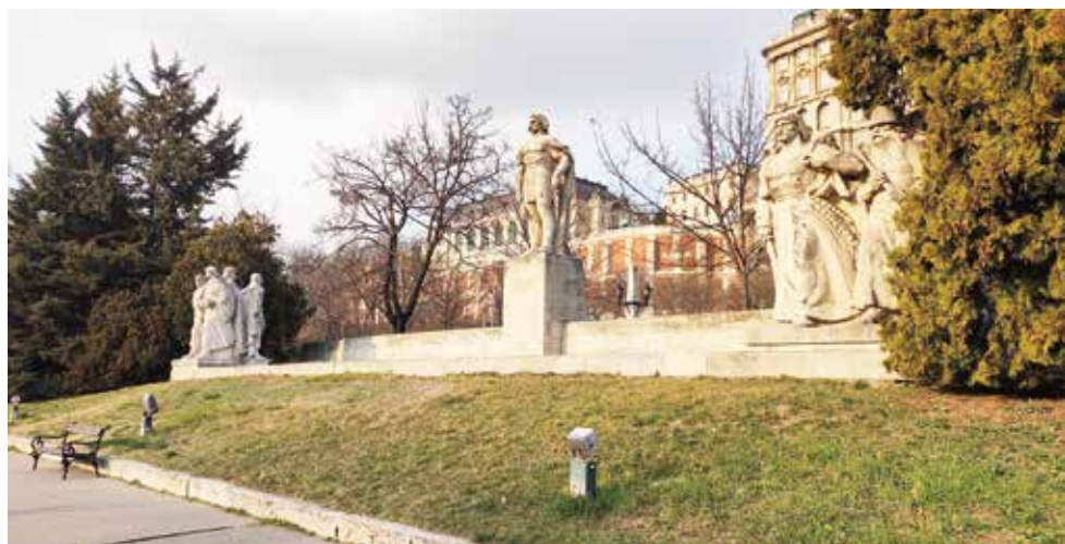
Az Attila úti Dózsa-emlékmű, amely előtt a Pasarét irányába közlekedő 5-ös autóbusz megállója áll. Néhány lépésre innen a Petőfi-pálya várja a tabáni futballhősöket...