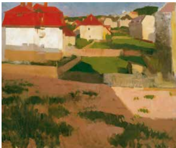
Aba-Novák Vilmos: Házak