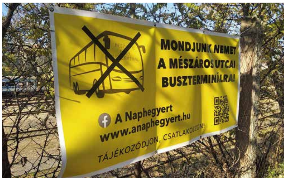
A buszterminál tervére nemet mondtak az itt élők! A helybéliek a Mészáros utca kerítése mögött elhaladó vonatokkal rég megbékéltek már, de a zajos buszok ide telepítéséről hallani se akarnak...