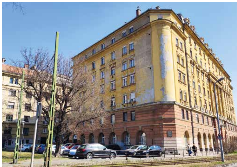
Erőd az Attila úton