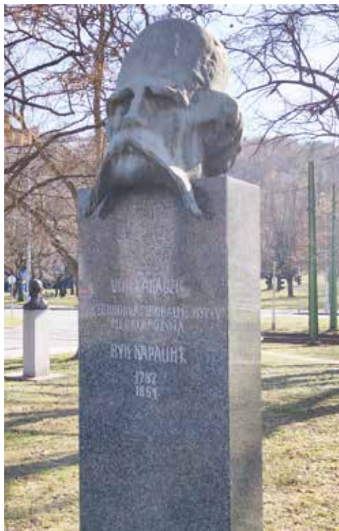
Kornelije Stanković, szerb zeneszerző e városrészben született. Vuk Stefanović Karadžić, a szerb irodalmi nyelv megújítója hazajárt a Tabánba.