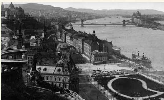
Amikor még a Szent Demeter templom is állt.... (1907) (Fotó: Fortepan / Deutsche Fotothek / Brück und Sohn)