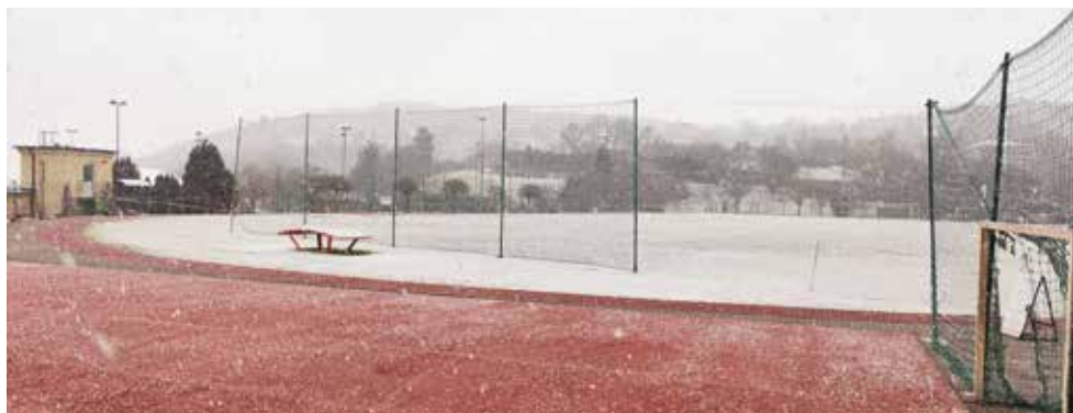
A Czakó-pálya csak akkor üres, ha iskolaidő van és esik a hó, vagy amikor a sporttelepet bezárják éjszakára. 2022-ben egyetlen napon láthattak hópelyheket az itt élők: február 28-án, egy hétfő délelőtt...

Márpedig, ha a Tabánban időzünk, ha a tabáni széphistóriát kutatjuk, nem lehet elfeledkezni a láblabdázás nemes hagyományáról, örületéről. Dzsentrík és munkásgyerekek, arisztokraták, papok, gyárosok sarjai és idetelepített külvárosi vagányok, apák, fiúk rúgták/rúgják erre-felé a bőrt. A Petőfi-pályán. A Tabáni ketrecben. A Czakó utcai sporttelepen. A Szilágyi Gimnázium salakosán. A hajdani Kosci be-