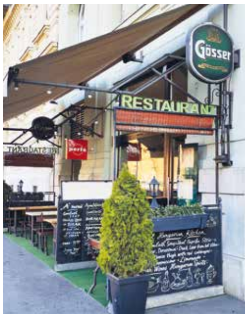
Az Attila úton még léteznek jellegzetesen tabáni kisvendéglők...