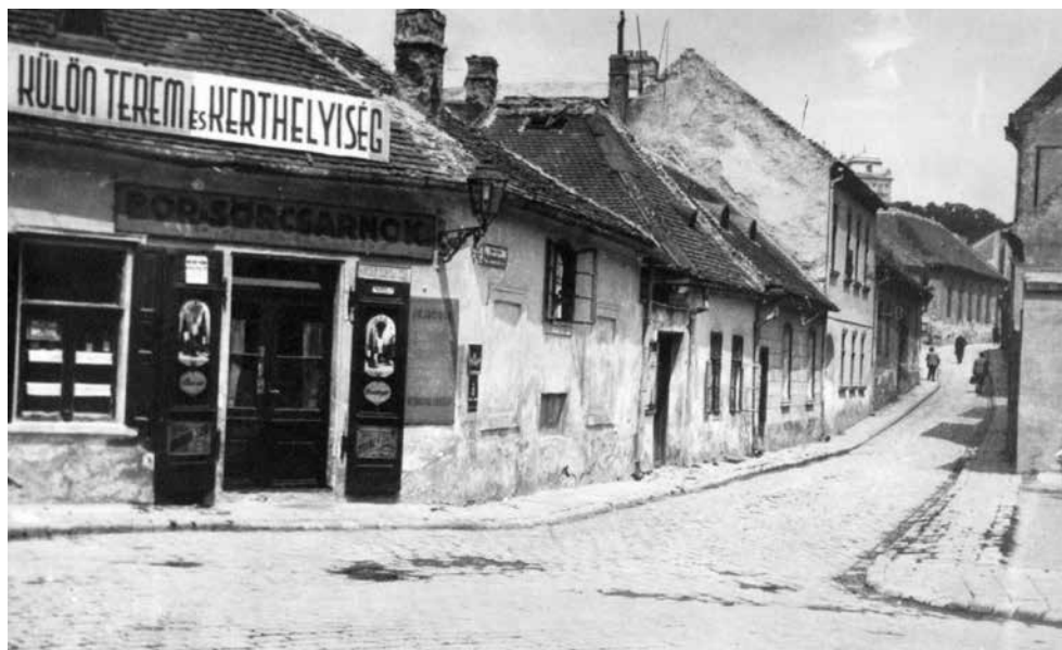
Hadnagy utca, 1928

A Kereszt tér sarkán álló Kozanek vendéglőről csak kevesen – a bennfentesek – tudták, hogy itt sütik a különlegesen fűszerezett lacipecsenyét, csúszott is rá a kancsóban felszolgált kellemesen hűtött bor, a gourmand-ok mint a sáskák lepték el, talpalatnyi hely sem maradt a kicsiny kocsmában. A kocsmajárásban gyakorlott férfiak a bejáratosak fensőbbiségével nem étlapot kértek, hanem spejzettelit, nem reggelit, hanem gábelfrüstköt fogyasztottak és spriccert ittak rá a színes terítékes asztaloknál, ha felengedett sűrűségéből az éjszaka.”